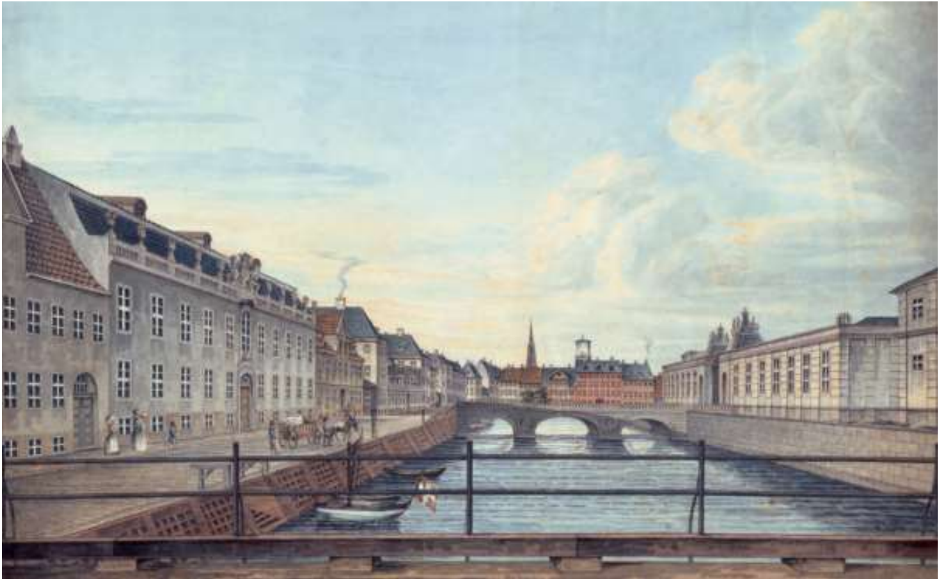
Frederiksholms Kanal set fra Prindsens Bro omkring 1826, til venstre Plessens Palæ. Akvarel af H.G.F. Holm, Københavns Museum.

Hendriksens Kjøbenhavnske Billeder . Værdien af denne afbildning forekommer tvivlsom, når man sammenligner med den gengivelse af palæet, som fremgår af en akvarel af H.G.F. Holm fra omkring 1826, der findes på Københavns Museum. I Fødselsstiftelsens arkiv i det tidligere