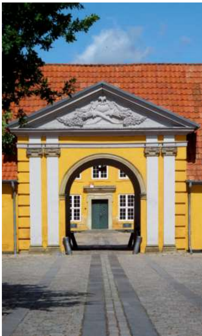
Palæet i Roskilde set fra Stændertorvet. Foto: Claus M. Smidt, 2021.

form for pynt, mod gårdspladsen (indkørslen fra nord) pranger facaden med portpartiets rustikke pilasterportal, kronet af våbencartoucher (Plessen og Skeel), der smyger sig om midtervinduet. Portens flankerende vinduer i stueetagen har kraftfulde kvaderrammer og fordakninger og overetagens vinduer enklere rammer med ører. Mod syd står bygningen i ubehandlede røde tegl, mod nord pudset og gulkalket med hvide bosserede pilastre og gesims. Selv den stejle mansards kvistvinduer er med til at afrunde billedet af en bygning i fuldendt harmoni. Indenfor i porthusets hjørne imod hovedbygningen er der en fortryllende lille trappe, der i sin enkle skønhed giver ide om den trappe, der oprindeligt må have været i hovedbygningen, men som ulykkeligtvis er fjernet på et uvist tidspunkt.