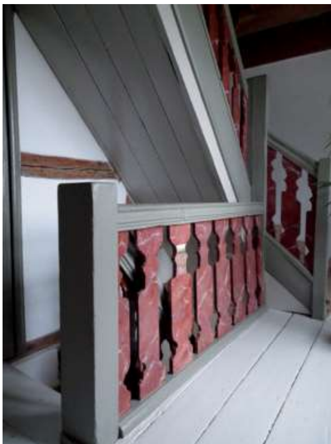
Trappe i porthuset på Selsø. Foto: Søren Lundqvist, 2017.

Anderledes forholder det sig med porthuset. Det har arkitekturhistorikerne været ødsle med at tilskrive snart den ene, snart den anden. Somme tider Philip de Lange, andre tider Felix Dusart († 1735), sågar holsteneren R.M. Dallin har været foreslået. Ganske forsigtigt har kulturhistoriker Niels Peter Stilling senest foreslået, at Lauritz de Thurah (1706-59) kunne være involveret. Årsagen er selvsagt bygningens kvalitet. På trods af, at der egentlig kun er tale om en ombygning/udvidelse, fremtræder