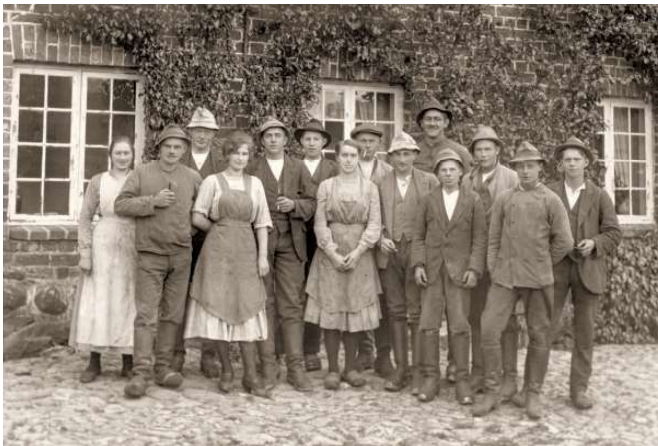
Folkeholdet foran en af avlsbygningerne på Gammel Estrup, cirka 1918.

rene landbrugsbedrifter uden andet herskab end en forpagter. Her lå herskabeligheden ikke i hovedbygningen, men i de vældige avlsbygninger. Også på mange andre herregårde var den største og stateligste bygning ikke hovedbygningen, men laden, og selv på herregårde, hvor