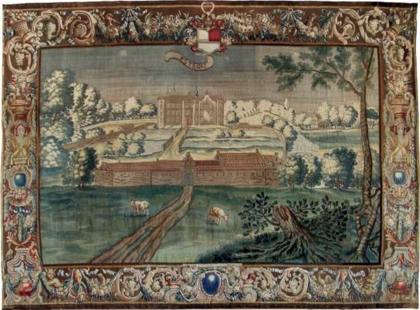
Gobelinerne i riddersalen på Gammel Estrup viser ejerens otte herregårde i tiden omkring 1690. Gammel Estrup var da som nu et storslået anlæg, der i hovedsagen stammede fra begyndelsen af 1600-tallet. Anlægget omfattede både hovedbygning og avlsbygninger, og vejen til hovedbygningen gik gennem avlsgården.