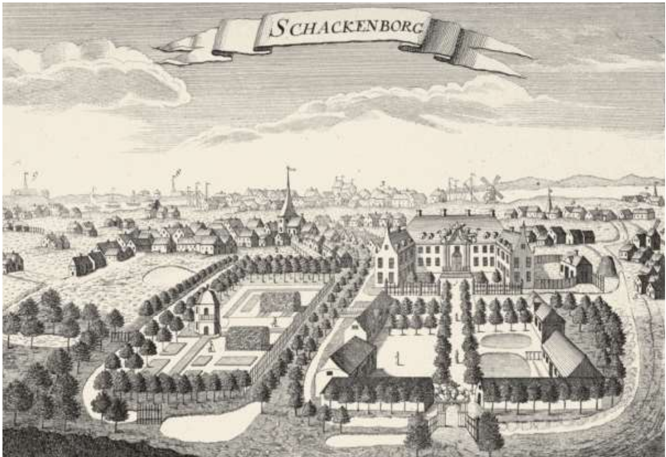
Schackenborg er en meget sjælden undtagelse fra reglen om, at danske herregårde ikke bare var herresæder, men også gårde. Her blev avlsgården nedlagt, da hovedbygningen blev bygget i 1660'erne. Det senere Schackenborg gods var skabt ved at sammenkøbe en række gårde, som lå spredt. Principielt lignede godset dermed den engelske model. Kobberstik af Jonas Haas efter forlæg af H.H. Eegberg, 1768.