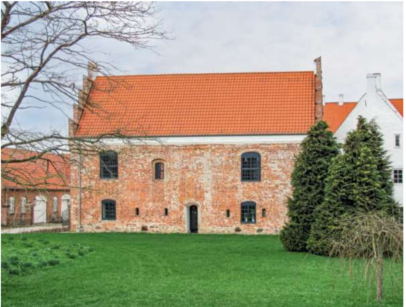
Omkring år 1500 var Tjele sæde for en adelsmand af middel status og centrum for et mellemstort gods. Ved samme tid opførtes denne bygning, som da var herregårdens stateligste hus. Det er et slående udtryk for, at selv ret store herregårde havde langt jævnere bygninger end senere.