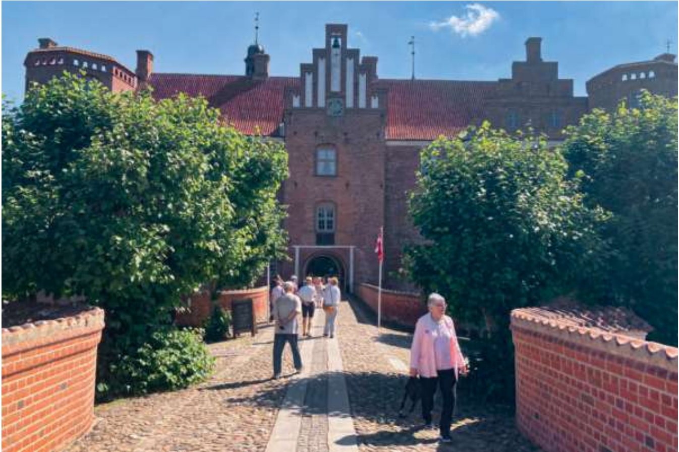
Som det skete for så mange andre herregårde, måtte Gammel Estrup sælges som følge af lensafløsningen, og siden 1930 har hovedbygningen huset et herregårdsmuseum – i dag Gammel Estrup Danmarks Herregårdsmuseum.

ver stadig deres ejendomme og bor stadig i hovedbygningerne, men de klarer sig som regel med meget lidt hjælp i hovedbygningen, og landbruget drives af få folk. Tættest på den gamle verden er vi nok i virkeligheden,