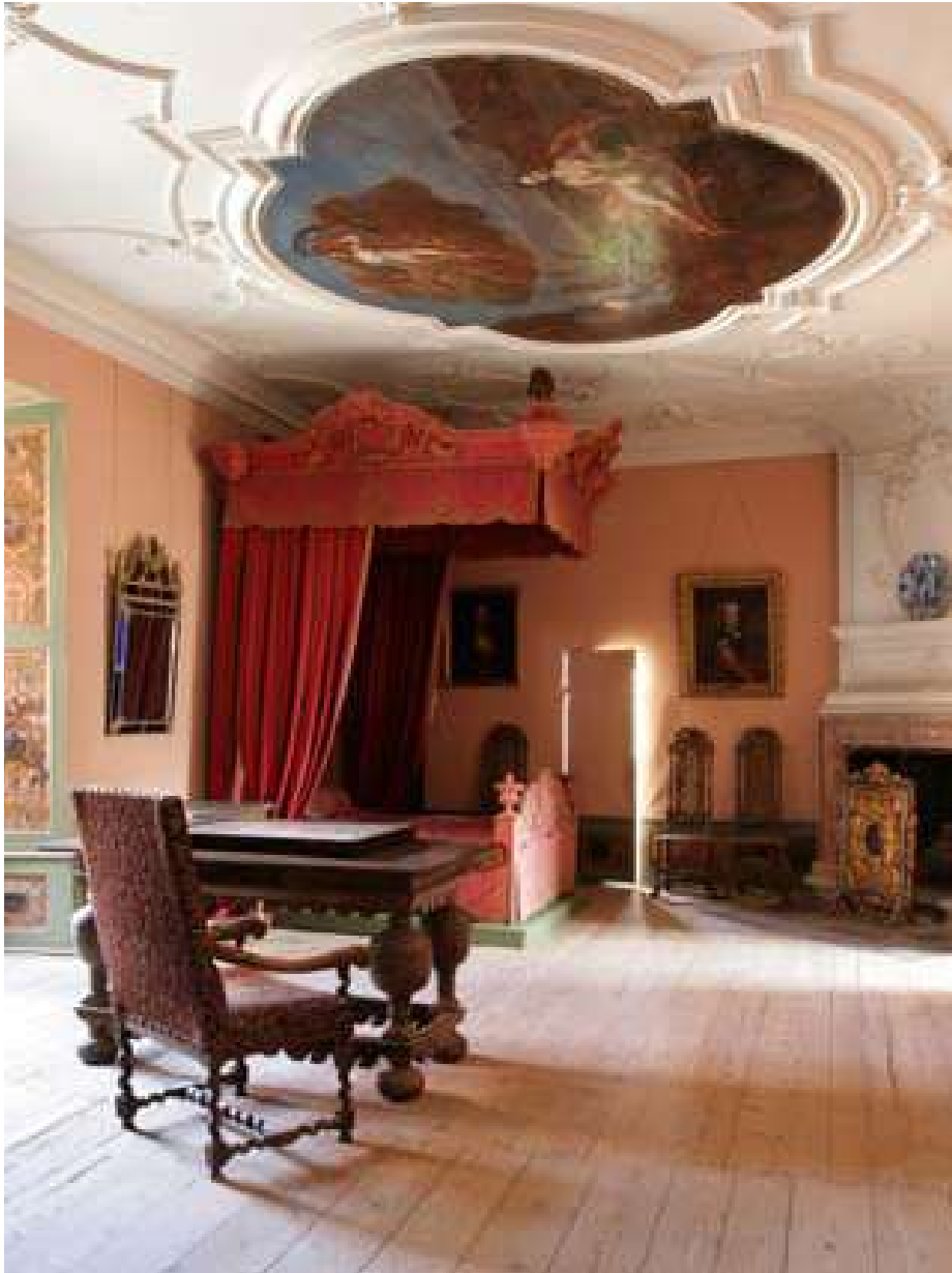
„Prinsessesengen“, som mange små piger i årenes løb har døbt denne paradeseng fra starten af 1700-tallet, blev i 2006 og 2007 restaureret og genopstillet i Rødestuen.