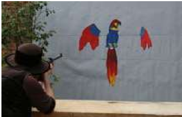
Begrebet at skyde papegøjen stammer fra skydeselskaberne, hvor man skød til måls efter en papegøje af træ. Ved åbning af udstillingen i september kunne publikum også få lov til at skyde til måls efter en papegøje.

Det var en udstilling, som havde været på tegnebrættet i en årrække, men først i 2007 var ideen modnet så meget, at udstillingen kunne realiseres. Takket være stor velvillighed fra Skydeselskabet på Sølyst, har museet over en toårig periode fået tilladelse til at vise 22 af de smukke skiver – fortrinsvis de adelige – i Jægerstuen på anden sal. Skydeselskabet i hovedstaden er det ældste af sin art i Danmark og kan føre de stolte traditioner tilbage til 1400-tallet. Generelt opstod skydeselskaberne i byerne i middelalderen og var oprindeligt sammenkomster, hvor medlemmerne morede sig med at skyde til måls efter en papegøje af træ, placeret højt oppe i et træ. Medlemmerne tilhørte samfundets elite, og selvom højborgerskabet ofte var stærkt repræsenteret, talte medlemsskaren gennem