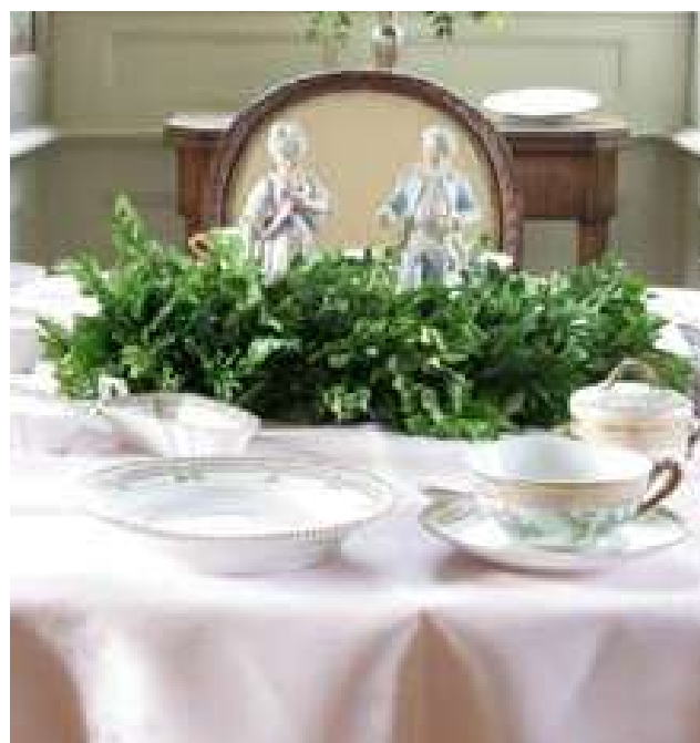
Ifølge overleveringen påbegyndte Den kgl. Porcelænsfabrik fremstillingen af pragtstellet Flora Danica som en gave fra den danske regering til Katharina den Store. En moderne udgave af det smukke stel var en del af særudstillingen Til the på Gammel Estrup i 2007.

videreudvikling og dermed fortsat overlevelse. Den fremadrettede udstilling om Realdanias seneste indsats på herregårdsområdet løb frem til efterårsferien, hvor havens agapanthus og pommeranstræer blev sat ind for vinteren. Den tilbageskuende, kulturhistoriske udstilling om herregårdshavernes udvikling gennem tiden er imidlertid tænkt som et permanent element i det østre orangeri, hvor den skal formidle herregårdshavernes historie for de mennesker, som benytter det østre