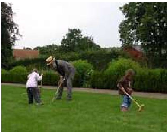
På Gammel Estrup må man gerne betræde græsset. I et forsøg på at få de besøgende til at benytte havens græsarealer noget mere, satsede museet i 2007 på blandt andet spil og udendørslege.

net. Menuen bestod af gåsesteg med hvide og brunede kartofler og rødkål til. Det afveg ikke meget fra, hvad der blev serveret for greven og hans familie. Kun drikkevarerne og desserten var forskellige. Mens man i Folkestuen skyllede middagen ned med øl og spiste risengrød til dessert, drak herskabet vin og spiste ris á l'amande til dessert. Fælles for herskab og tjenestefolk var juletræet i Riddersalen . Her fik tyendet lov til at komme op og gå med grevefamilien rundt om træet og synge salmer. Traditionen tro var der julegaver fra herskabet til tjenestefolkene. Stuepigen kunne måske være heldig at få stof til en pæn kjole, mens tjeneren fik en skjorte og husjomfruen en taske, lidt husgeråd eller linned. I tilknytning til juleudstillingen havde mu-