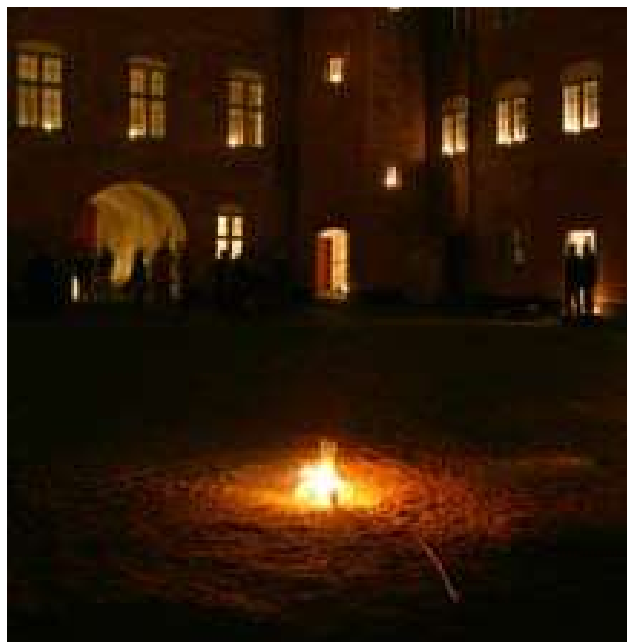
I skæret fra levende lys og bål kan publikum Allehelgensaften høre de gamle sagnhistorier om Gammel Estrups tidligere beboere.

Senere på sommeren var der for andet år i træk Holbergkomedie på Gammel Estrup, og det var et rigtig herregårdsrelevant stykke – Henrich og Pernille – idet tjeneren Henrich bilder tjenestepigen Pernille ind, at han er ejer af indtil flere herregårde. Ludvig Holberg skrev stykket i starten af 1700-tallet, og det blev opført