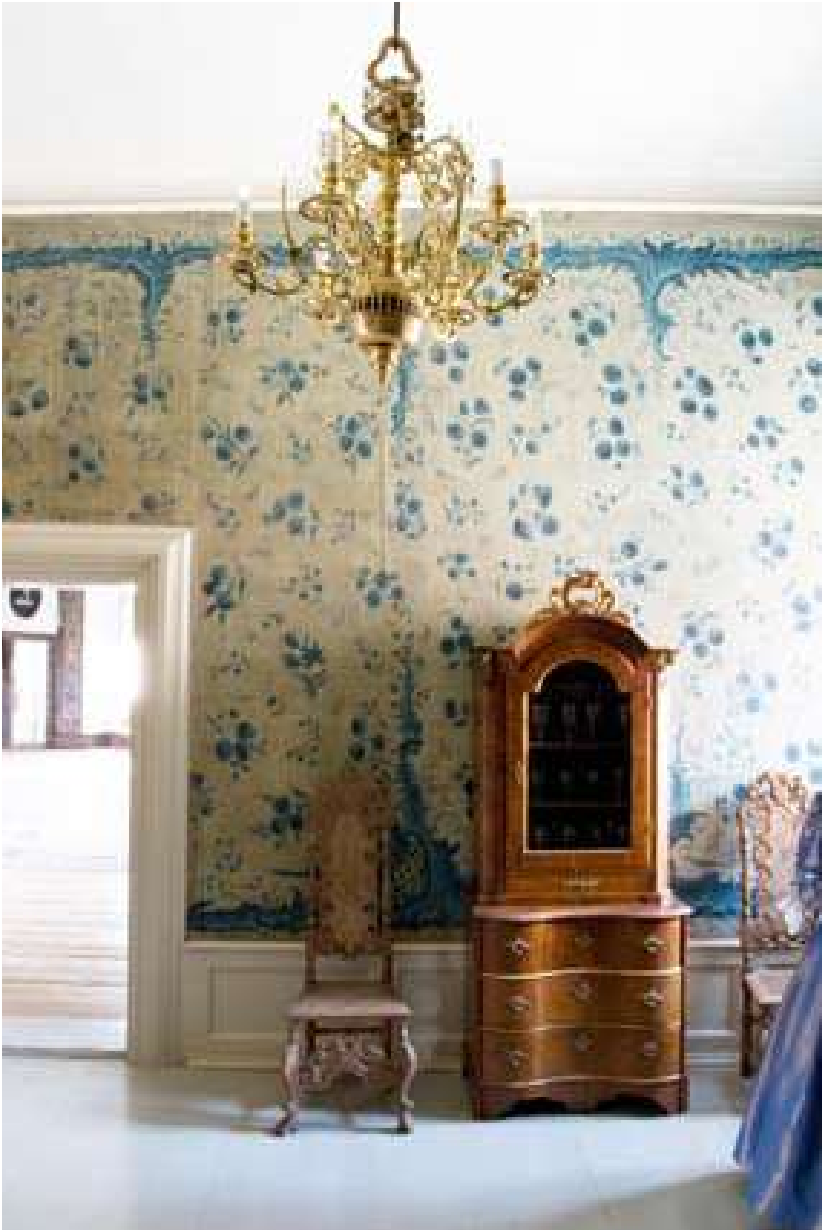
Krista og Viggo Petersens Fond har bidraget til erhvervelsen af denne smukke 1700-tals krone, som nu fuldender entréen til første sal; Forgemakket.