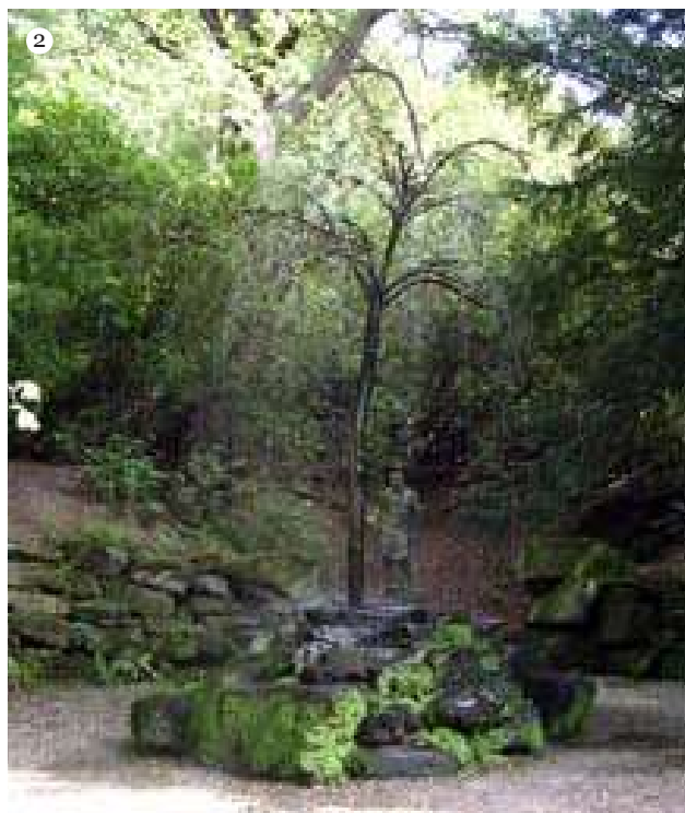
Store vandanlæg var på den tid sjældne og bekostelige, og at have dem i sin have var et udtryk for høj status. The Willow Tree Fountain blev „plantet“ i Chatsworths have i 1692, og man bliver ganske overrasket over at finde det bladløse, vandrislende træ i en lille lysning. En statue af Pan står i baggrunden.

Den 4. jarl – senere den 1. hertug - af Devonshire var en herre med store politiske ambitioner. I 1686 påbegyndte han en større ombygning af Chatsworth, og haven skulle naturligvis svare dertil. I 1690 fik han tidens førende havedesignere, George London og Henry Wise, til at omdanne de eksisterende parterrehaver omkring Chatsworth og tegne nye. Haven blev nu op-