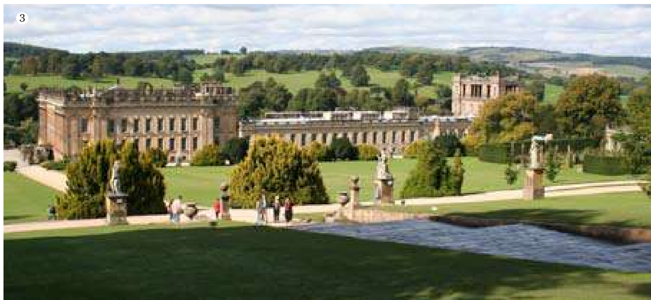
Browns vision om et organisk landskab rundt om Chatsworth er endnu meget synlig. Fra kaskaden ses, hvordan græsarealer og træer veksler i de bløde bakker.

I 1760'erne lod den 4. hertug landskabsarkitekten Lancelot "Capability" Brown 2 omdanne Chatsworths have og det omgivende landskab til en velfriseret helhed. Brown var på den tid den mest benyttede og berømte landskabsarkitekt, og han var kendt for at skabe organiske og „naturlige“ landskaber, der strakte sig fra hovedbygningen til træerne i horisonten. Nye love på den tid favoriserede velstående jordejere, og lovene gjorde det muligt for dem at indhegne store landområder. Man skyede ingen midler for at sikre