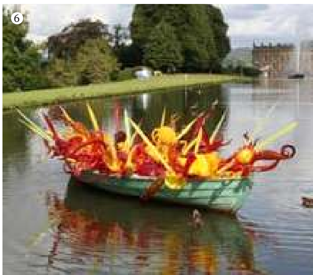
6 I den fjerne ende af The Canal Pond lyste en robåd fyldt med mundblæste glasfigurer i røde, orange, gule og grønne nuancer op. Figurerne var lavet af Dale Chihuly, og robåden lignede en lille ark med små blæksprutter, fiskehejrer og storke. Foto: Niels Peter Stilling.

– en forstbotanisk have. Den unge Joseph Paxton var i 1826 blevet ansat som førstegartner, og hans store talent for planter og bygninger resulterede i skelsættende bygningsværker på Chatsworth. Mange kender nok Paxtons berømte Crystal Palace, som blev bygget til den første Verdensudstilling i 1851, men allerede i 1840 havde Paxton bygget verdens største glashus på Chatsworth, The Great Conservatory. Huset var 84 meter langt, 35,5 meter bredt og 20 meter højt, og det skulle, i forening med orkidéhuse og liljehuse, være hjemsted for de store mængder af planter, som blev hjembragt fra ekspeditionerne.