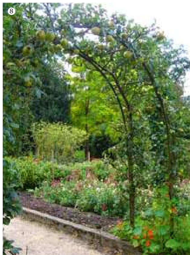
På Chatsworth ses en utrolig smuk indgang til køkkenhaven. To klassiske stenskulpturer flankerer indgangen, og bag dem overvældes man af bed efter bed af sirligt anlagte højbede med et væld af grøntsager, frugter og blomster.