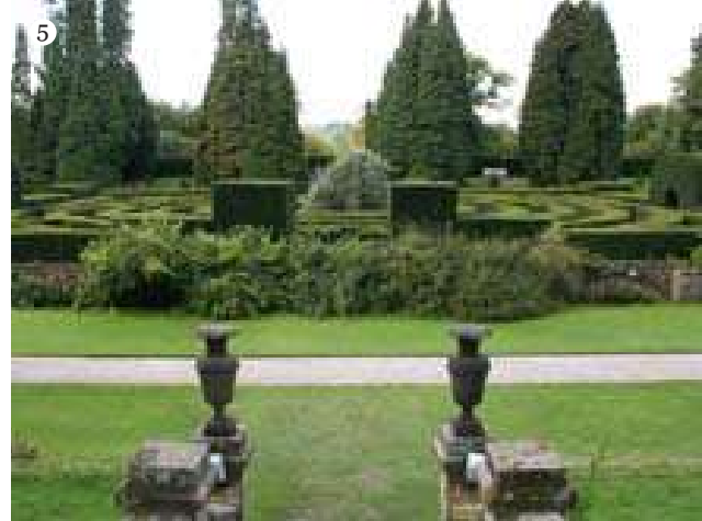
Under 1. Verdenskrig var der ikke kul og mandskab nok til at vedligeholde The Great Conservatory, og det forfaldt så meget, at det i 1920 blev besluttet at rive det ned. I 1962 blev arealet omdannet til en taks-labyrint med blomstrende bede for hver ende. Rundt om labyrinten og bedene ses endnu sandstensfundamentet til The Great Conservatory.

herregårdsejernes privatliv; byer blev flyttet, veje blev omlagt, og brede læbælter blev plantet. Tiden bød på en udvikling af geværer til jagt, og en yndet fritidsfor-nøjelse blev jagten på vildt. Landskabsparkerne gav ideelle forhold til opdræt af vildt, og ydermere var det mere lukrativt at udnytte græsningsmulighederne og tømmeret i en landskabspark frem for at satse på agerbrug.