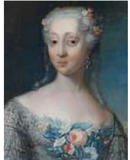
Andreas Møllers to portrætter af henholdsvis Charlotte Amalie Skeel fra 1736 og Frederik V fra 1740 viser to forskellige stilarter; det repræsentative, mørke barokportræt påvirket af Wahl, der havde stort værksted i København, og det farvestrålende tidlige rokokoportræt påvirket af moden i det sydlige Europa. Udsnittet fra Birte Rosenkrantz' portræt afslører, i sammenligning med kronprinsens, ligheden i ansigtets proportioner og position. Fotos: David Slater, Gammel Estrup. Malerierne tilhører Det Nationalhistoriske Museum på Frederiksborg Slot. Førstnævnte er deponeret på Rosenholm og de to andre på Gammel Estrup.

bud efter den vidt berejste maler, og mange af Møllers billeder fra den tid blev ikke signeret. 9