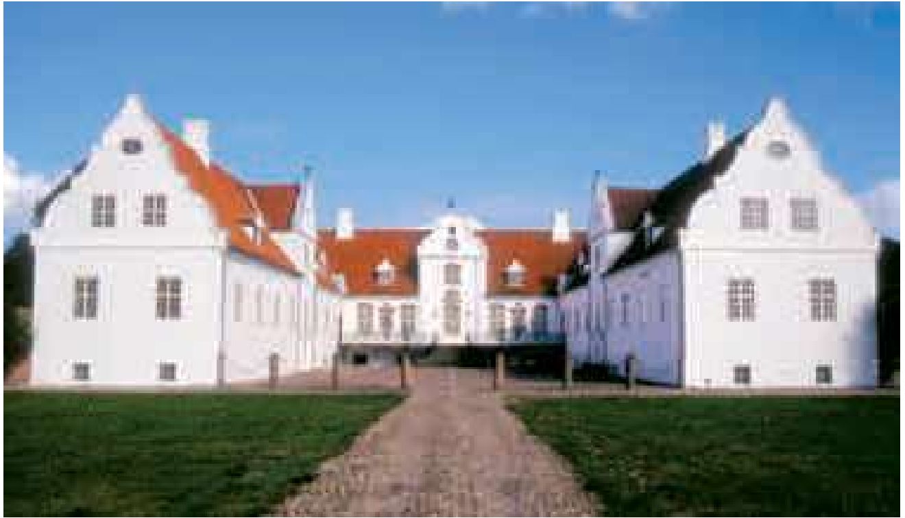
Herregården Bidstrup danner udgangspunktet for den arkitektoniske del af pilotprojektet.

tilpasninger, dette måtte kræve i form af for eksempel parkeringspladser, cafeteriaer og/eller udvidede toiletfaciliteter. Herregårdene ændrer sig altså – og dermed forandrer herregårdshelhedernes kulturarvs-værdier sig også.