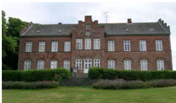
Steensgård på Langeland. Havefacaden er symmetrisk, næsten klassicistisk, med fremhævet, trekantspydet midterparti. Her fra er adgang via en fransk dobbeltdør til terrassen med udsigt over haven, der skråner ned mod en sø med åkander. Fredsomelig idyl, langt fra associationer om skumle gotiske borg.

Bygningen er tung og massiv, og de enkelte bygningsdele holdes tæt ind til „bygningsskroppen“; der er ikke noget, der rager ud, alt er samlet, sluttet og tæt. Huset giver indtryk af soliditet. Det er rustikt med de ujævne, lidt forvitrede mure i rå mursten og