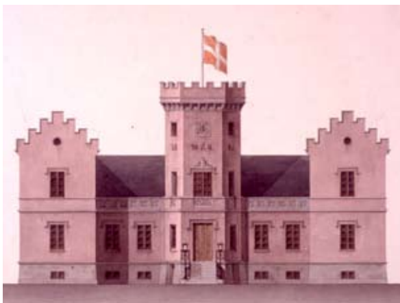
Gjerdrup. Forslag fra 1841 af G.F. Hetsch. Samlingen af Arkitekturtegninger, Danmarks Kunstbibliotek.

Taarne, en smuk portal, Værelserne malede pompeianske.“