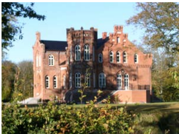
Ussinggård, opført i 1859 af en tysk arkitekt for M.F.V. Lotz, er en lille borg med kamtakker, ottekantede tårn og krenelerede tinder. Borgkarakteren er knap så overbevisende som på Basnæs.