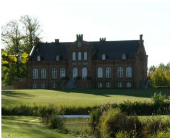
Ussinggård ved Horsens. Som et tidstypisk træk er forsiden mod gården asymmetrisk, mens havesiden er regulær og helt symmetrisk.