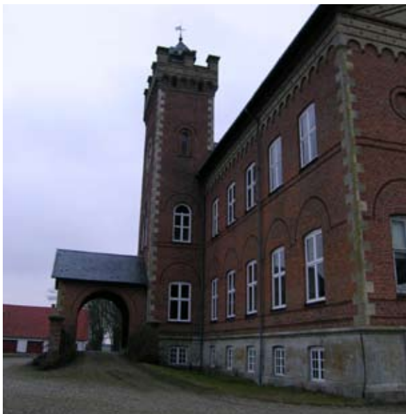
Gyldenholm, opført i 1863-64 af J.D. Herholdt for C.A.D. de Neergaard.

gård Erholms arkiv. Erholm blev også ombygget i nygotisk stil – i 1850-54 af arkitekten J.D. Herholdt i en lidt udvandet version af middelalderborgen – og følgende sang blev skrevet i anledning af, at det nye hus stod færdigt: