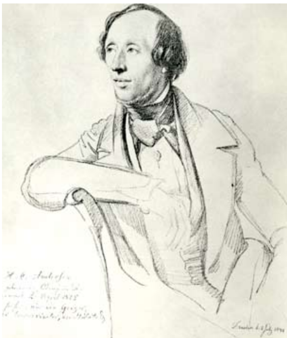
H.C. Andersen besøgte Dresden i 1841, hvor han blev tegnet af kunstneren Vogel von Vogelstein. Det var efter denne rejse, at H.C. Andersen blev en hyppig gæst på de danske herregårde.

hun forstod at forkæle den følsomme digter, så han følte sig godt tilpas. Der var tit en spøgefuldstemning på herregården, og det gik som oftest ud over den stakkels digter, som dog tog det med godt humør. Familien Lindegaard kunne f.eks. finde på at putte oldenborrer og ærter i forfatterens seng, og hvis det ikke var nok til at forskrække digteren, skulle hanen under hans seng nok give den tiltænkte effekt! 2 Det