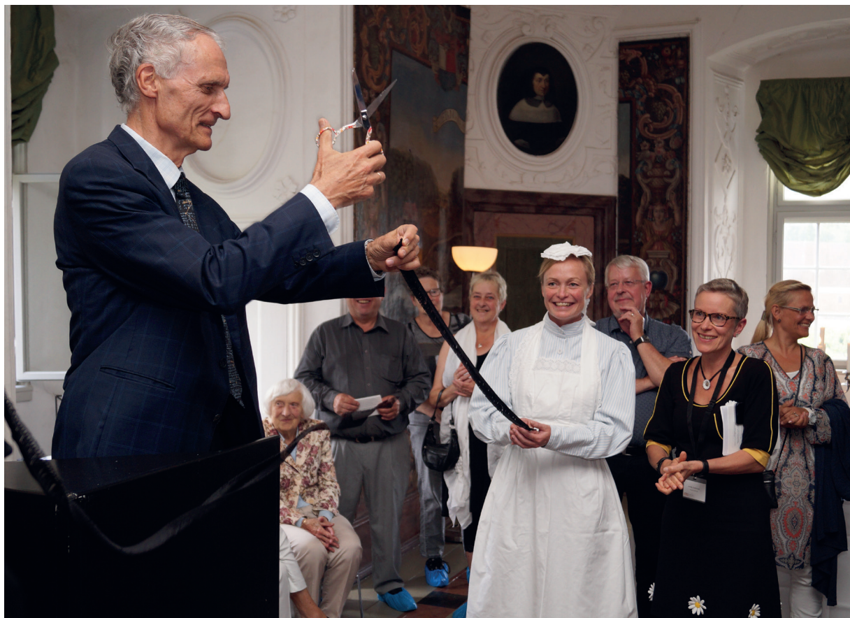
Kulturminister Bertel Haarder klippede snoren til udstillingen Familiens og privatlivets herregård, som åbnede i sommeren 2016.

For dem, der ikke havde mulighed for at besøge Gammel Estrup i 2016, blev der året igennem formidlet herregårdskultur og -historie gennem trykt informationsmateriale, i pressen og på internettet.