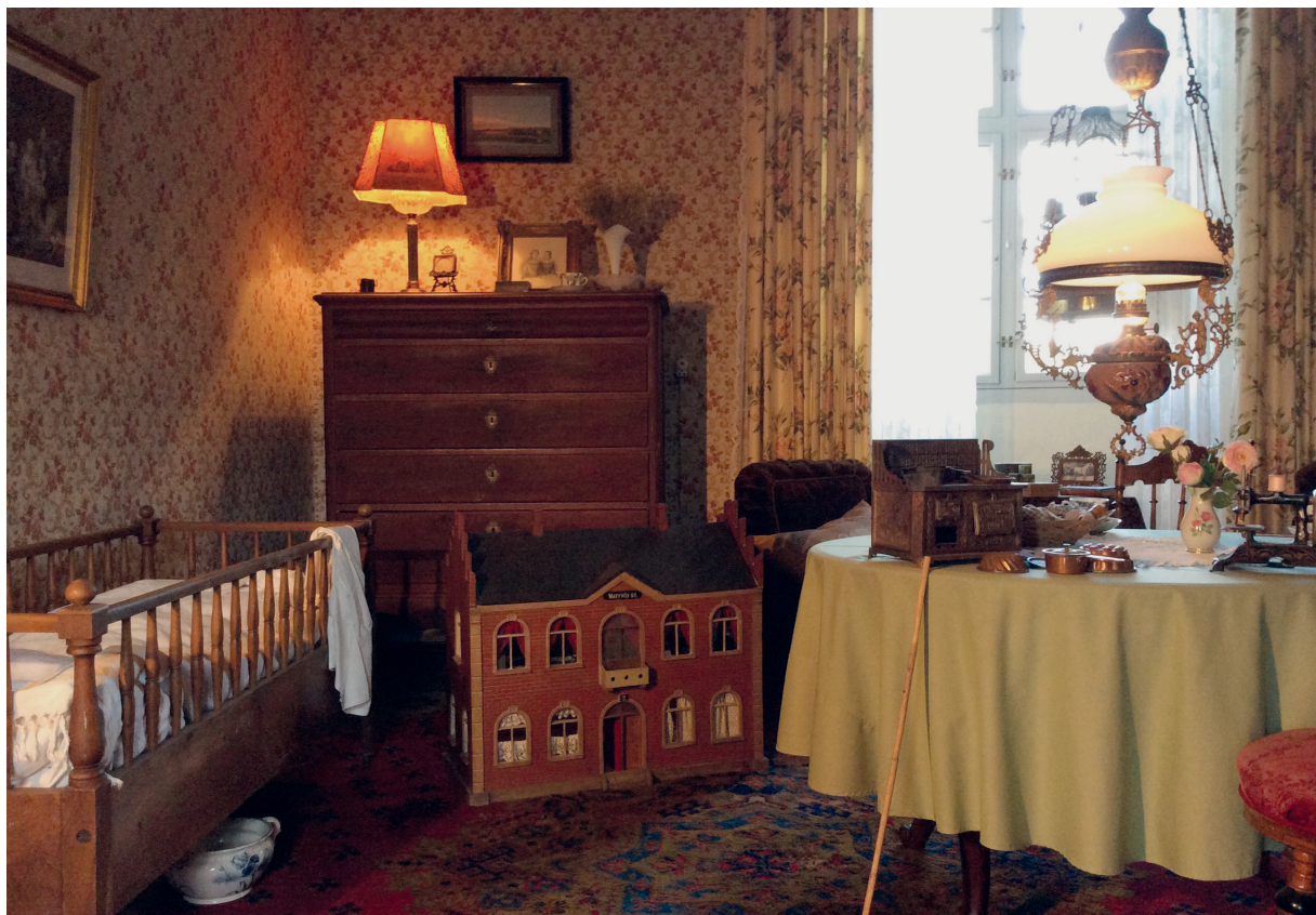
Børnestuen på Gammel Estrup er en del af udstillingen Familiens og privatlivets herregård . Stuen illustrerer, hvordan man i anden halvdel af 1800-tallet anså kernefamilien som ideal, og hvordan børneværelset derfor blev placeret tæt på forældrenes soveværelse.

om familiens liv og de inderlige følelser, der bandt den sammen. De mange nips fyldte hver en ledig flade i stuen, og hver af de små ting repræsenterede et minde eller andet, der følelsesmæssigt for-