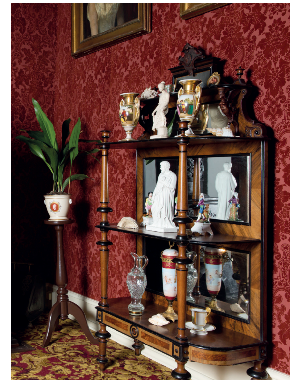
Nips var en vigtig del af det sene 1800-tals indretningsstil. Her ses en etager med nipsgenstande som vaser og figurer.

Endelig blev der i forbindelse med projektet Familiens og privatlivets herregård indsamlet en skærm til herskabets soveværelse. Ved siden af dagligstuen blev der nemlig indrettet et soveværelse, hvor både herren og fruen sov. I sidste del af 1800-tallet var ægtefæller begyndt at dele soveværelse, hvilket står i kontrast til tidligere tider, hvor det var kutyme, at ægtefæller i samfundets elite havde hvert sit soveværelse, der lå i forbindelse med hvert deres appartement i huset. Men i sidste del af 1800-tallet opstod idealet om det kærlighedsbaserede ægteskab, og det fælles soveværelse var en naturlig følge heraf. Nyt var det også, at soveværelset blev et fuldstændig privat rum, hvor kun familien og dens tjenestefolk kom. Tidligere var soveværelset til dels et repræsentativt rum, hvor særligt fornemme og betroede venner og bekendte kunne inviteres til te og konversation. Som følge af udviklingen mod det private soveværelse var rummet heller ikke længere så udsmykket, som det var tidligere, hvor blandt andet paradesenge, smukke tapeter og malerier gjorde rummet eksklusivt. Det var ikke nødvendigt, da det ikke længere skulle vises frem. I soveværelset kunne herskabet tillige vaske sig og tage bad i et lille zinkbadekar. Ganske vist havde man ikke rindende vand, men periodens mange tjenestefolk gjorde, at der var ansatte nok til at løbe op og ned ad trapperne efter varmt vand til herskabets bad. Disse toiletfaciliteter var gerne gemt af vejen bag en