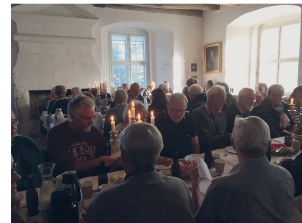
Frivillignetværket er en vigtig del af Gammel Estrup – Herregårdsmuseets virke. I 2016 havde netværket tiårsjubilæum. Her ses et af de to årlige møder, der afholdes for de frivillige.

Den sidste del af året blev uhyre intens og nervepirrende for alle på museet. Første del blev indledt, da