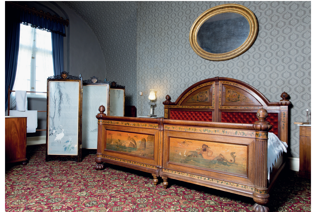
Dobbeltseng fra Rathlousdal, som blev restaureret i 2016, og som nu står i Soveværelset, som er en del af udstillingen Familiens og privatlivets herregård.