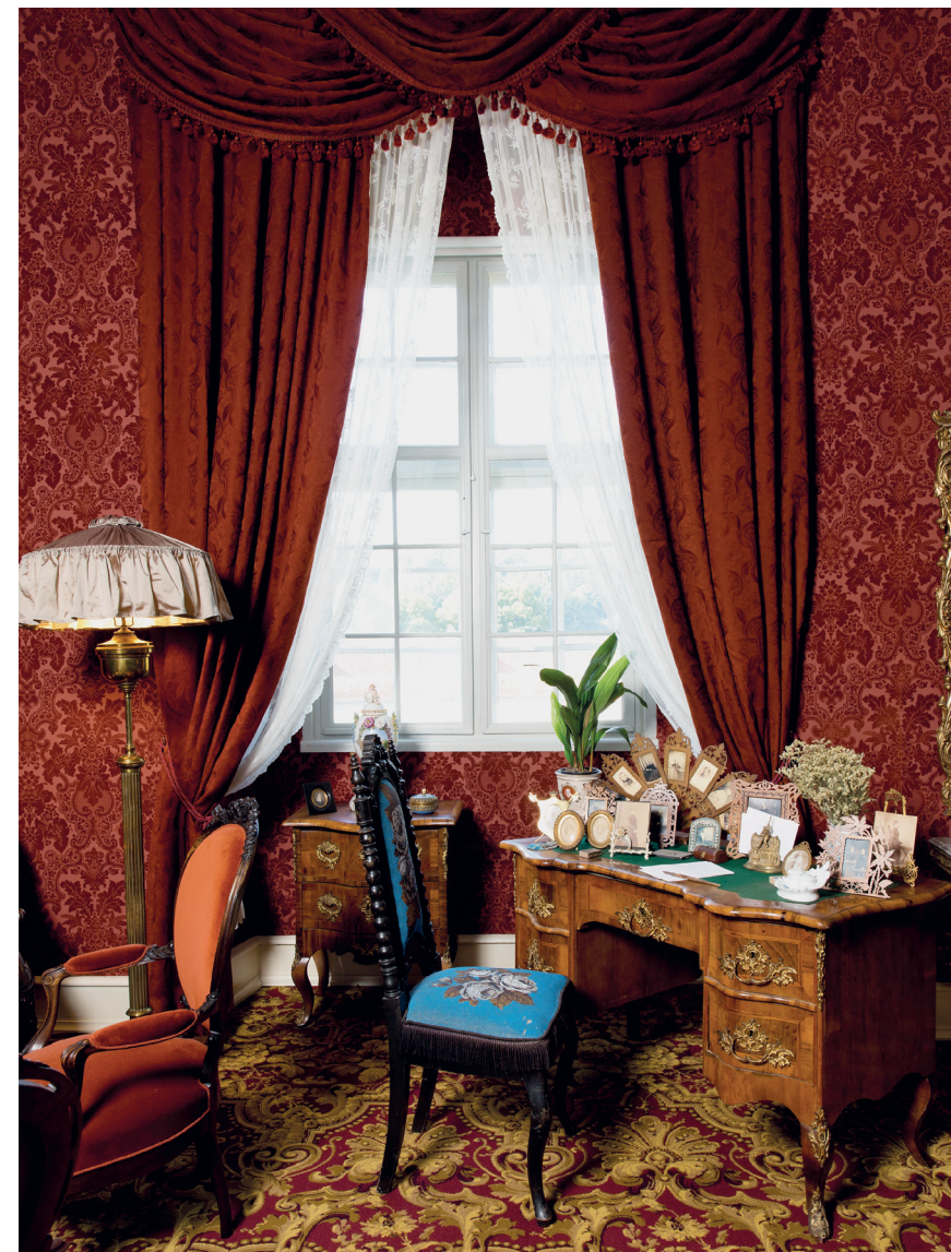
Originalt gardin fra slutningen af 1800-tallet, som i dag pryder Dagligstuen i udstillingen Familiens og privatlivets herregård .

Også på genstandssiden koncentrerede museets bevaringsindsats sig om Familiens og privatlivets herregård . På museets magasin fandtes et meget fint gardin fra sidste del af 1800-tallet. Gardinet var fremstillet af tung ulddamask i et fantastisk mønster i en kraftig rødbrun farve, der var meget populær til dagligstuer i perioden. Gardinet var draperet og bestod af to sidegardiner, der skulle hænge på hver sin side af vinduet, og tre mindre stykker, der hver for sig skulle draperes op i tre „tunger“, der udgjorde den øverste del af gardinet over vinduet. Desværre havde gardinet en del skader, dels fra sollys, som havde mørnet stoffet, dels fra skadedyr, der havde været i gardinet for mange år siden. Men heldigvis havde Museum Østjyllands dygtige konservatorer mod på opgaven, og de fik nænsomt repareret stoffet, hvor det var gået i stykker, og samtidig skabt et stykke såkaldt „offerstof“ – et nyt stykke stof – der blev syet på gardinet på den side, der kom til at vende ud mod solen, for at beskytte det originale stof. Således lykkedes det at få det originale gardin fra Gammel Estrup på plads i Dagligstuen ,