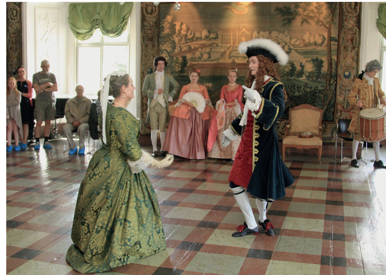
Til Herregårdsmarkedet 2016 havde museet entreret med en dansemester, som indviede aktører og publikum i 1700-tallets dansekunst.

Allehelgensaften bød traditionen tro på en helt unik tasmørkeoplevelse, hvor alle sanser blev udfordret. Man kunne gå gennem de stearinlysoplyste sale og gemakker og høre de spøgelseshistorier, der knytter sig til stedet, eller man kunne opleve fortidens overtro i den dystre kælder eller i herregårdshaven, der – til stor glæde for de besøgende – blev inddraget i arrangementet i 2016.