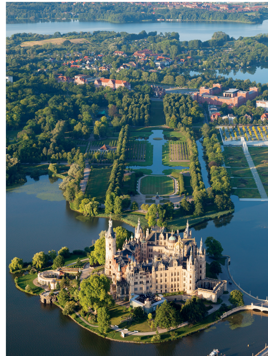
Som en del af Dansk Center for Herregårdsforskning Aarhus 2017-projekt Herregårdene – en europæisk historie arrangeredes i 2016 flere busture til slotte og herregårde – for eksempel en rejse til Nordtyskland, hvor turen blandt andet gik til slottet Schwerin i Mecklenburg-Vorpommern.