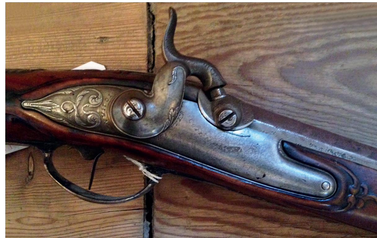
Jagtbøsse fra Gammel Estrup, der i 2016 blev erhvervet til museets samling.