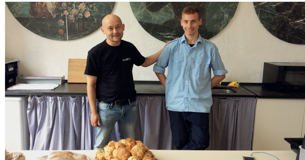
Den praktiske grunduddannelse i Hornslet drev café i det ene orangeri hele sommeren.