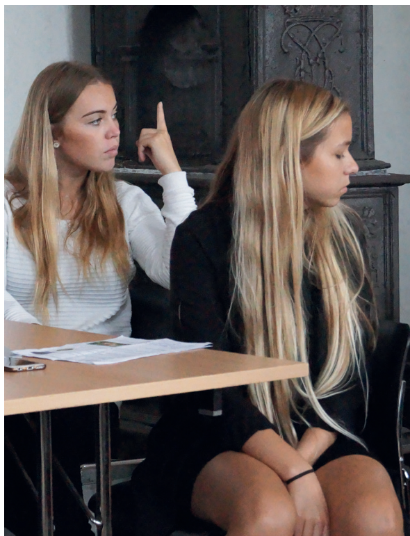
Elever fra 2.g på Paderup Gymnasium havde undervisning på Gammel Estrup flere gange i løbet af 2016. Formålet var at udvide læringsrummet og knytte bånd mellem gymnasium og museum til glæde for både elever, lærere og museumsfagligt personale.

omkring 800 børn og unge deltog således i museale læringsaktiviteter i det forgangne år.