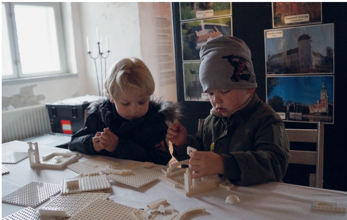
Til Forskningens Døgn kunne små bygmestre bygge deres egne slotte og herregårde i LEGO-klodser.