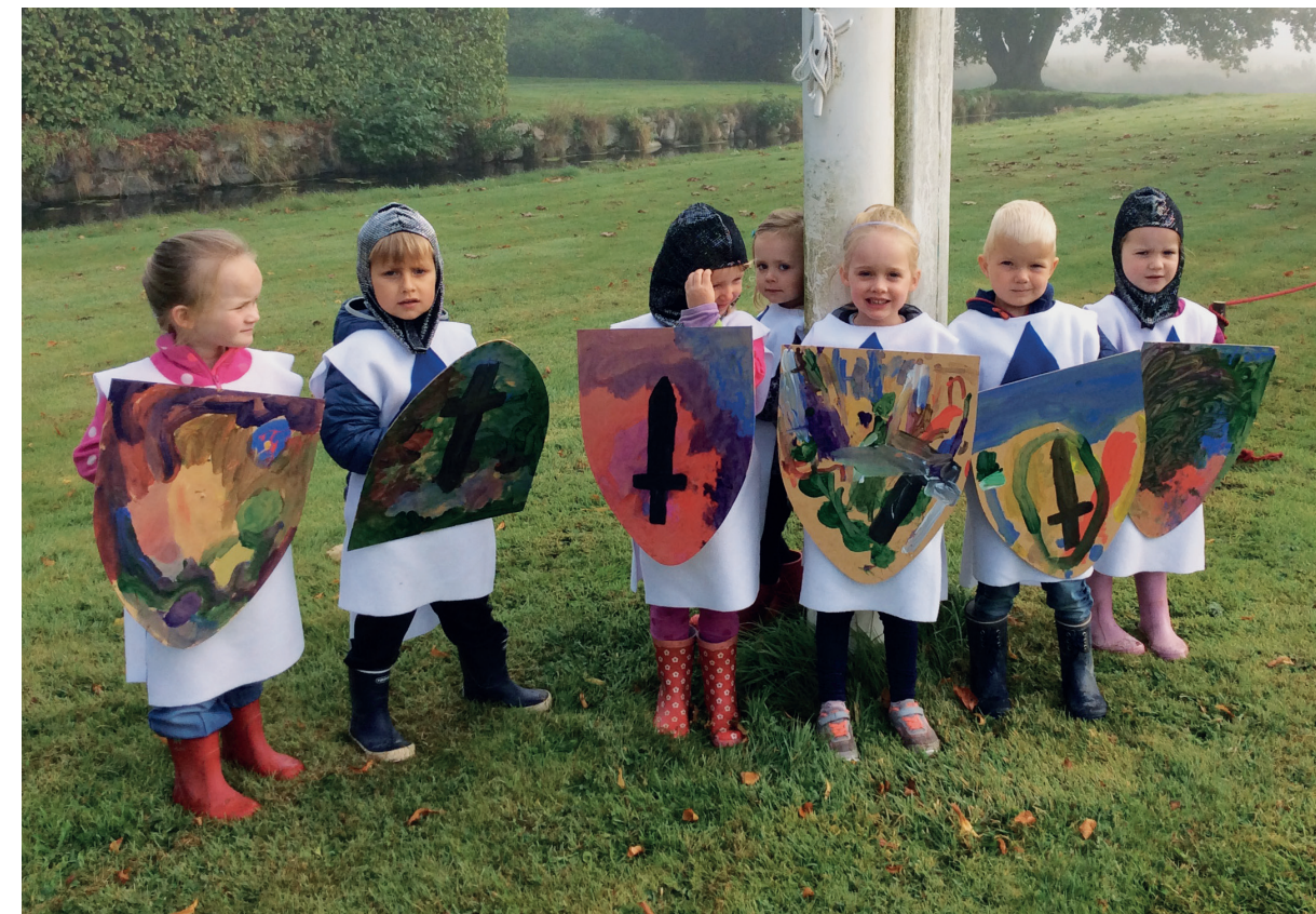
Museet arbejdede i 2016 med en række forløb for børnehavebørn. Her prøver børn fra børnehaven Bette-bo i Øster Alling livet som ridder på egen krop.

2016 bød også på et væld af aktiviteter for de mindste, da museet med projektet Kulturkontrakten , som ligeledes var støttet af Slots- og Kulturstyrelsen, havde fokus på kulturel læring på museet for børn i kommunens børnehaver med fokus på børn i Gammel Estrups umiddelbare nærområde. Børnenes gryende historiebevidsthed blev stimuleret gennem legende og kreative aktiviteter med fokus på rollespil og udklædning. Gammel Estrup dannede således ramme om forløbet I lære som ridder , hvor de mindste iklædt ridderdragter prøvede kræfter