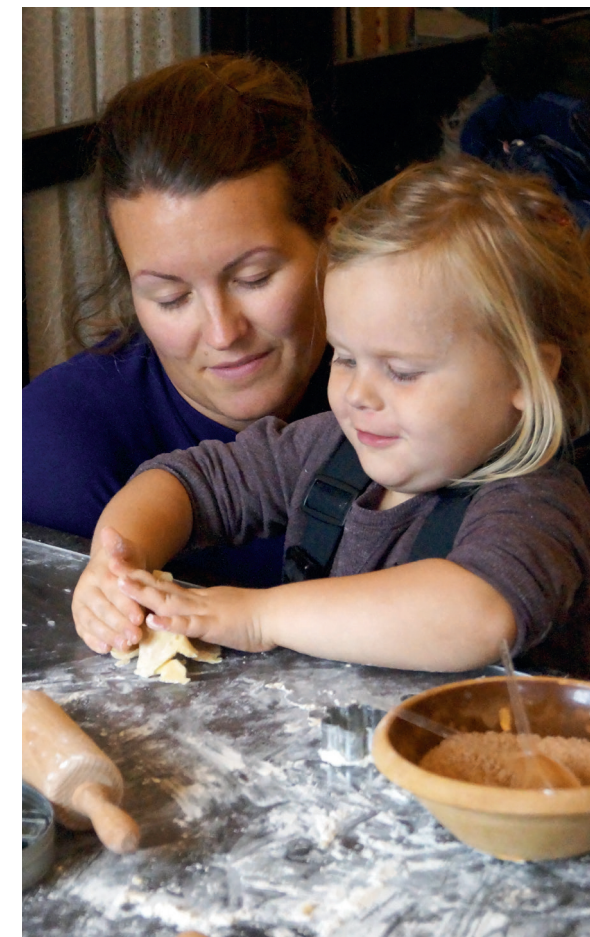
I alle ferier blev børn inviteret til at deltage i særlige historiske børneaktiviteter. Blandt andet til Jul på Gammel Estrup, hvor der var bageværksted.

Museets frivilliggruppe var en vigtig medspiller i afviklingen af de mange arrangementer året rundt. De frivillige var både med i formidlingen som aktører ved markedet og i juletiden, og de var med bag kulissen som brandvagter, praktisk hjælp og som værdifulde ambassadører for museet. Desuden var de med til at bemane Herregårdskøkkenet ved alle arrangementer og i alle skoleferier. Hver tirsdag og torsdag året rundt kunne man møde sygruppen i Syværkstedet og høre om tilblivelsen af historiske dragter og tekstiler. Alle onsdage kunne man møde havegruppen og høre om deres arbejde med den historiske køkkenhave, og torsdage i sommerhalvåret kunne man følge blomstergruppens arbejde med at lave blomsterdekorationer til herregårdens mange stuer. De frivillige var således igen i 2016 med til at