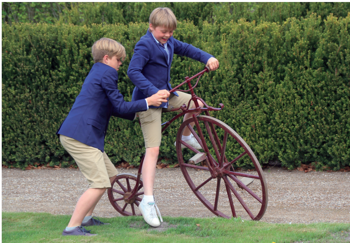
I pinsen 2016 kunne man opleve udstillingen Fine fornøjelser , og børn og barnlige sjæle kunne prøve fornøjelserne på egen krop og for eksempel tage en tur på en såkaldt „væltepeter“.

højsæson for museet med rigtig mange besøgende, og det er blevet en uundværlig begivenhed for både museet og publikum.