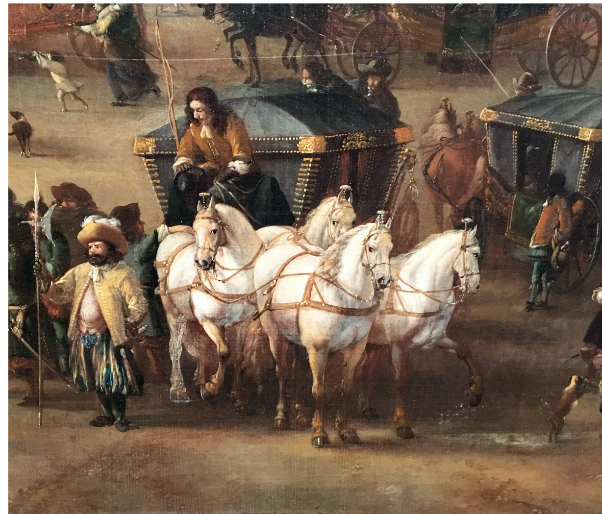
En fornem sort karosse trukket af fire hvide heste baner sig vej gennem de travle gader i Paris. Hest og vogn var i datiden det primære transportmiddel over land, men det var ikke en billig fornøjelse at lade sig transportere på så standsmæssig vis, som det ses på dette billede. Pieter Wouwerman 1623-1682. Statens Museum for Kunst.