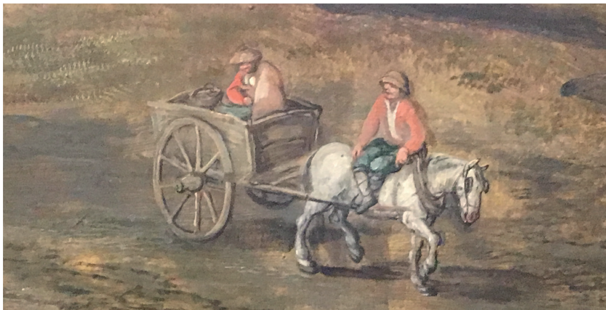
Sammenlignet med herskabets gangere var der ikke megen pomp og pragt over bøndernes heste, som ofte var langt mindre end adelens. Joss de Momper cirka 1620. Statens Museum for Kunst.

forærer paven af det neapolitanske rige. Vi så siden, hvorledes kardinalerne red ind i monte cavallo , og der red først hver kardinals kammertjener med et rødt fløjsstykke, hvorpå kardinalernes våben var stukket med guld, siden [red] en ganske hob andre folk til hest ... 11