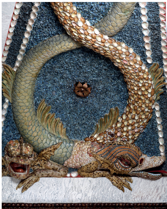
Fabeldyr, der snor sig ind i hinanden. Detalje fra vægdekoration i Grottesalen i Neues Palais.

udfoldelse, der ellers var fast bestanddel i tidens europæiske hoffer, som for eksempel på Versailles . I sammenligning var Sans Souci intimt og privat, et stærkt iscenesat idealbillede på et tilbagetrukket liv helliget litteraturen, kunsten, filosofien og musikken. Slottet var indrettet med kongens private appartement til den ene side: gallerigang, forgemak,