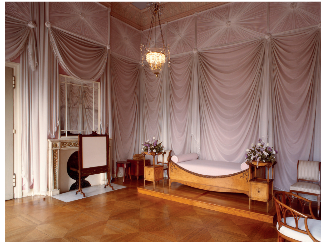
Dronning Luises (1776-1810) soveværelse på Charlottenburg var den første opgave, den unge arkitekt Karl Schinkel (1781-1841) udførte for kongefamilien. Indretningen fremviser klassicismens nye formsprog med sans for romantikkens følsomhed og naturlighed. Den svage antydning af solopgang blev opnået ved hjælp af hvide lærredsvævede, slørlette og gennemsigtige gardiner (voile), der var ophængt foran lyserøde vægge.

Charlottenhof var beregnet til kronprinseparets retræte fra hoffet og var, i lighed med Sans Souci , indrettet til private ophold og med ganske få og simple gæsteværelser. Kronprinseparets afdeling var, i modsætning til tidligere, ikke indrettet med separate appartementer, men med et fælles soveværelse, to arbejdsværelser, dagligstue og spise-stue. De kongelige havde overtaget borgerlige idealer om et fælles familieliv bygget på kærlighed.