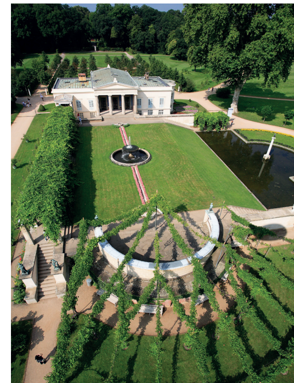
Charlottenhof, opført 1826-1829. Charlottenhof regnes blandt et af Karl Schinkels mesterværker inden for den preussiske klassicisme. Inspireret af et besøg i Pompeji og Herculaneum skabte han, sammen med eleven Ludvig Persius (1803-1845) og havearkitekten Peter Joseph Lenné (1789-1866), Charlottenhof som en romersk villa placeret i en have med vandkunst, kanaler, bassiner og fontæner. En stor portal med fire klassiske søjler dominerer havefacaden, der fører ind til spisesalen. Karl Schinkel stod også for interiøret, hvor den pompøse overdådighed var erstattet af en neddæmpet og formel enkelhed præget af marmor, stærke farver og møbler designet af Schinkel.

Den nye status stillede større krav til repræsentation og resulterede blandt andet i en storstilet udbygning af Schloss Babelsberg . Efter ombygningen, der varede helt indtil 1849, var slottet udvidet til en kolossal bygning, der var en fantasifuld kombination af tysk borg og engelsk nygotik. Ægteparret fortsatte med at benytte Schloss Babelsberg , også efter at han besteg tronen som kong Wilhelm