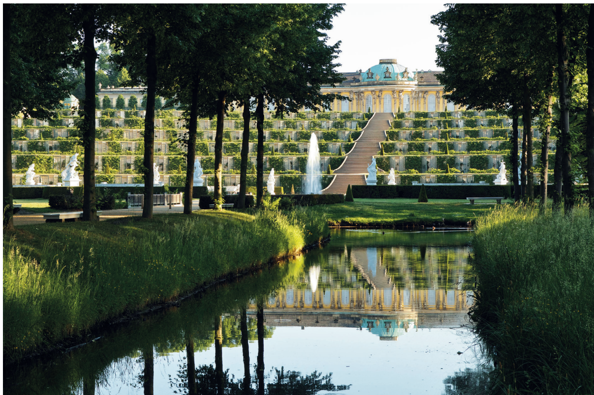
Sans Souci set fra havesiden med vin-terrasser og „Den franske rondel“ med marmorskulpturer af romerske guder. Sans Souci repræsenterer et af rokokoens mesterværker. Den tunge og pompøse barok er her afløst af et lyst og let, mere feminint udtryk. Sans Souci hæver sig mod syd over terrasser anlagt med vinstokke, og motivet går igen i slottets indretning, hvor vinranker pryder alle slottets værelser. Frederik den Store kaldte stedet for sin vingård (la vigne), hvor han kunne leve tilbagetrukket fra verden, omgivet af bøger, kunst og musik.

Et af disse var det sommerpalads, som hustruen, Sophie Charlotte af Hannover (1668-1705), fik opført lidt uden for Berlin omkring 1690, mens hun endnu