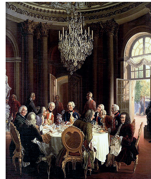
Frederik den Store (1712-1786) så sig selv som den oplyste monark, der i tråd med Oplysningstidens tanker havde ansvar for samfundets udvikling og sørgede for undersåtternes ve og vel. Middagsselskaberne på Sans Souci var berømte over hele Europa, hvor kongen inviterede tidens fremmeste filosoffer, videnskabsmænd og kunstnere til intellektuelle samtaler ved middagsbordet i havesalen. Maleriet er en senere fortolkning. Tafelrunde, malet af Adolph Menzel cirka 1852.

Sans Souci blev opført efter en symmetrisk grundform, hvor husets midterakse udgøres af Vestibulen og Havesalen. Slottets gæster blev mødt af en skulptur af krigsguden Mars med våbnene lagt for sine fødder. Det var en markering af, at Sans Souci skulle