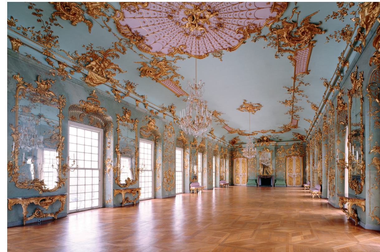
Det Gyldne Galleri på Charlottenburg er en opvisning i 1700-tallets forfinede og overdådige rokoko. Charlottenburg blev først opført som et mindre sommerpalads uden for Berlin, men senere ombygget ad flere omgange. Frederik den Store udvidede slottet omkring 1740 med „Nye fløj“, som blev udsmykket med rokokointeriører, der kom til at definere stilen ved hoffet i de følgende årtier. Charlottenburg er i 2017 Berlins største slot og anvendes fortsat til repræsentative formål, for eksempel statsbesøg.

des barndom i Nederlandene. Louise Henriette af Oranien døde ung, og da hendes søn overtog tronen, blev både bygninger og park udbygget til et pragtanlæg i den nye franske barokstil.