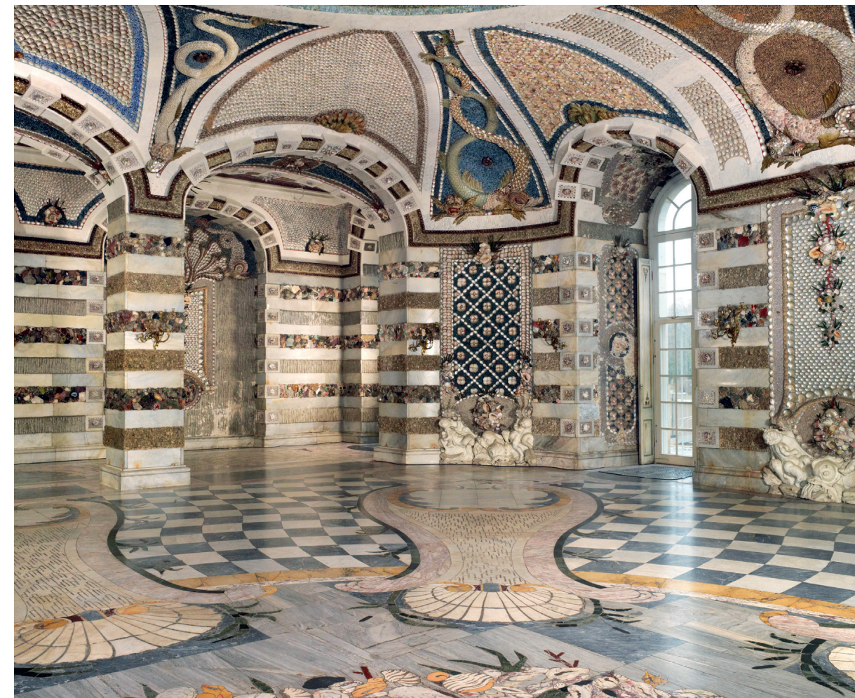
Neues Palais er et festfyrværkeri af legende og fantasifulde motiver, der viser rokokoens særlige fascination af huler, klipper og muslinger. Fra parken gik man direkte ind i den fantastiske og gådefulde Grottesaal (Grottensaal), egentlig havesalen, der blev skabt som underjordisk grotte direkte under slottets festsal. Her kunne gæsterne gå på opdagelse blandt klippestykker, marmor, muslinger og halvædelsten udfærdiget i kunstfærdigt udformede mønstre og maritime motiver som fisk og søuhyrer.

Neues Palais afsluttede Frederik den Stores byggerier i Potsdam, og mens det øvrige Europa så småt var begyndt at vende sig mod den nye stilart, klas-