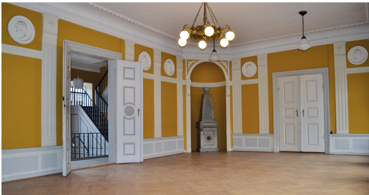
Salen, hvori taflet 21. juli 1843 fandt sted, findes endnu på første sal på den gamle Katedralskole i Nykøbing Falster.

juli må et festligt skue have åbenbaret sig her, i takt med at gæsterne til dagens taffel indfandt sig. Iført fuld uniform med glinsende ordenstegn og store rober dekoreret med de fineste juveler steg mænd og kvinder i en lind strøm ud af deres vogne for at indfinde sig i den store sal på Katedralskolens førstesal.