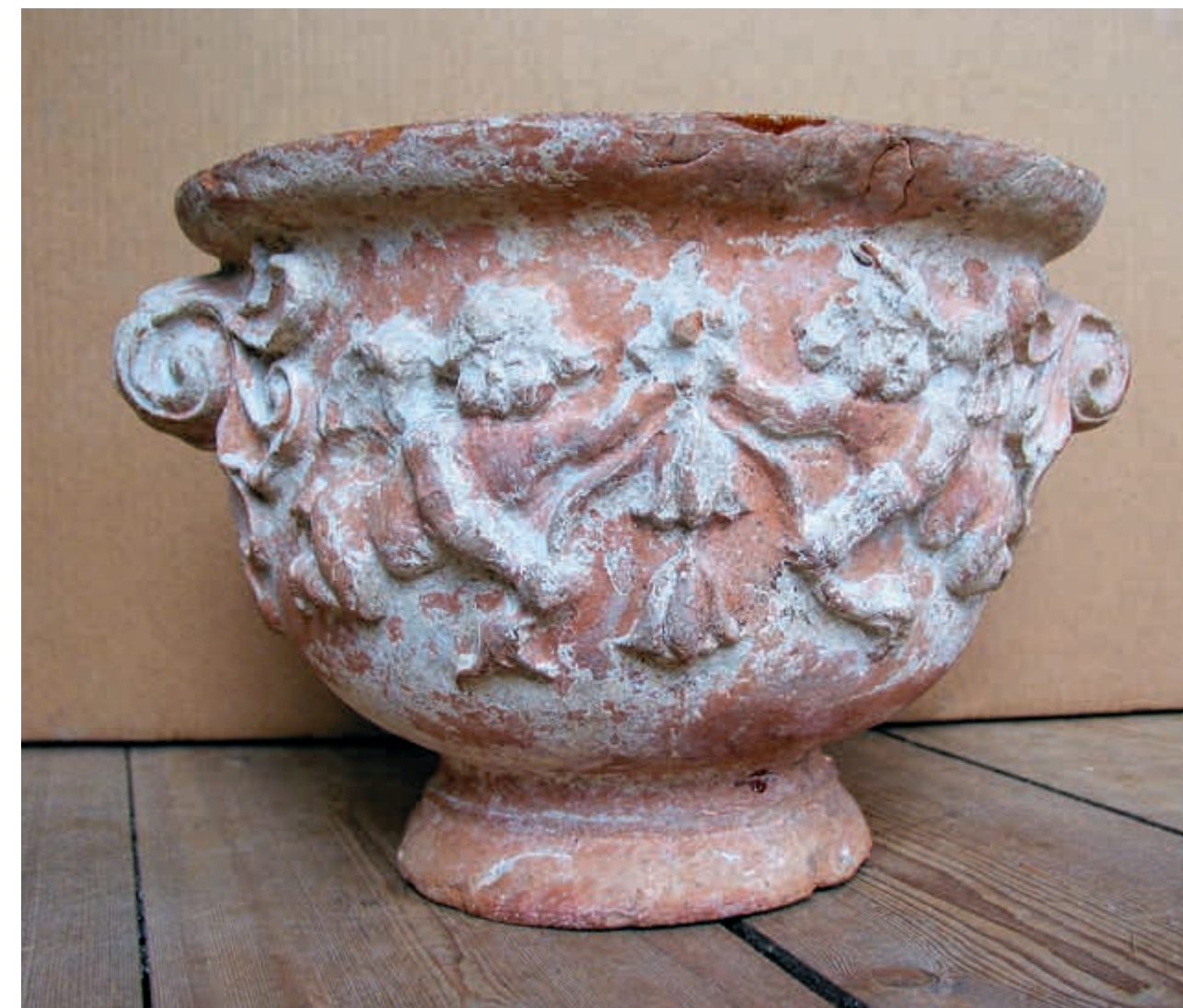
Udgravninger ved den gennemgribende restaurering i årene 1986-1992 frembragte i alt 24 terrakottavaser med fine ornamenter som puttier hængende i blomsterranker, løvomkransede våbenskjolde, havfrue- og akantushanke.

I forbindelse med arkæologiske udgravninger i 1980'erne og 1990'erne og derpå følgende restaureringsarbejder dukkede bunden af tre havevaser op og senere endnu flere potteskår og halve vaser, endda også en næsten hel vase med hanke formet som akantusblade og putti-figurer hængende i blomsterranker. Det samlede antal kunne opgøres til 24 vaser fordelt på fire hoved-