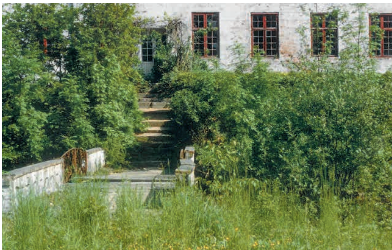
Trods bygningsfredningen af Sønderskov i 1918 var forfaldet i 1960'erne så fremskredent, at ejeren ønskede en nedrivning. Statens Bygningsfredningsfond forhindrede det, og en redningsplan blev gennemført i 1986-1992. Herefter overgik Sønderskov til Vejen Kommune, og Museet Sønderskov blev iværksat.

imidlertid i en sørgelig forfatning. Momsen-familien ejede Sønderskov i perioden 1804-1812 og igen i perioden 1819-1925. Ved salget var en nedgangsperiode begyndt, og på trods af fredningen tog forfaldet til. I slutningen af 1960'erne var hovedbygningen truet og