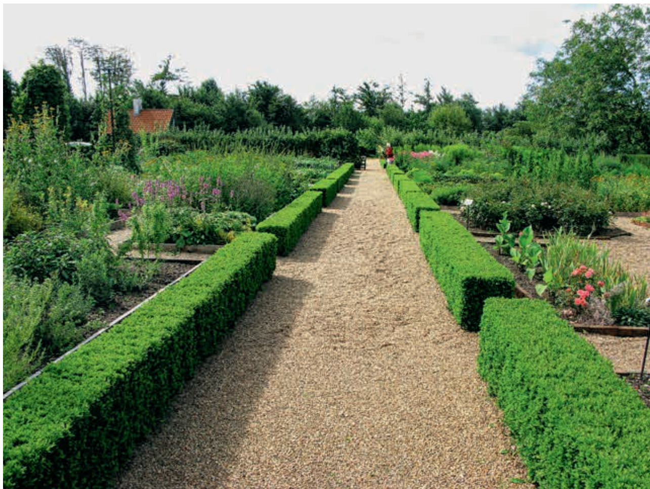
Den tidligere køkkenhave på Sønderskov er stadig køkkenhave. I dag drives den af frivillige fra museumsforeningen og kaldes Folkehaven. Afgrøderne fordeles mellem de frivillige, og restaurant Herregårdskælderen anvender også urterne i køkkenet.