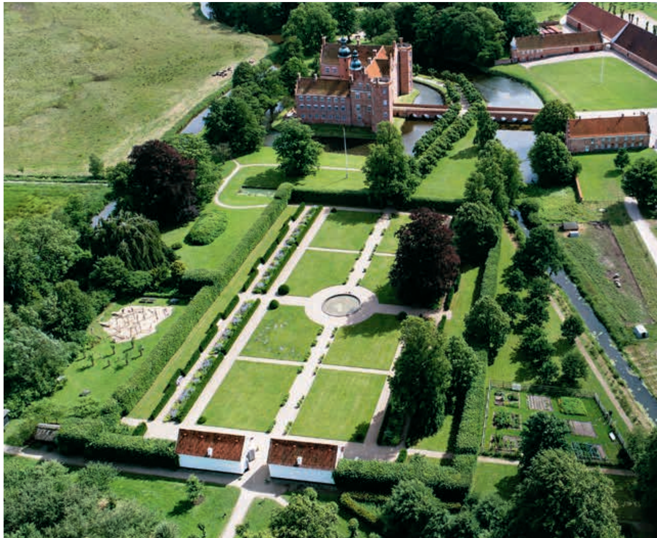
Renæssanceborgen Gammel Estrup fik anlagt barokhave uden for voldgraven i 1700-årene. En hovedakse går gennem den symmetrisk opbyggede parterrehave til de to orangeribygninger. Hovedaksen fortsætter som lindealle gennem bosquet- og frugthaven langt ud i kulturlandskabet.