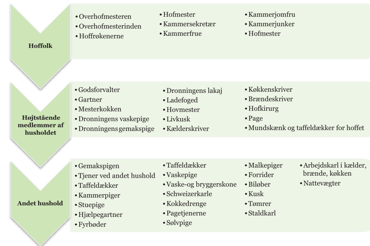
Figur 4. Husholdet inddelt efter rang

Husholdet hos Anna Sophie kan inddeles i tre overordnede grupper: hoffolk, højtstående medlemmer af husholdet og det resterende hushold. Der var en klart defineret rang mellem disse, men alle medlemmerne var vigtige, da alle udførte forskellige opgaver, som var med til at opretholde dronningens levestandard. Stillingsbetegnelserne, med tilknytning til Clausholm, er alle fundet i de anvendte kilder.