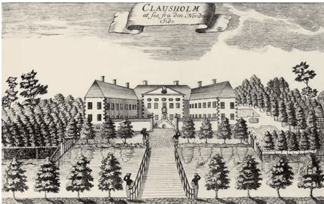
Gengivelse af Clausholm Slot fra 1767. Efter Pontoppidan, 1968, s. 438.

vurderet som klar til at huse et herskab fuldtid – og slet ikke en dronning. Derfor blev der foretaget forbedringer og ændringer. Blandt andet blev stuk og gulve forbedret, nogle paneler fik ny maling, i flere rum blev kammerne tillukket, og i stedet blev der indsat kakkelovne, de små blyvinduer blev flere steder udskiftet med store