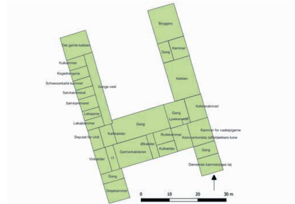
Figur 2. Indretningen af kælderen på Clausholm i 1743

Kælderen indeholdt praktiske rum i den vestre fløj, som køkken og bryggers, mens den østre fløj primært har været beboelse. Grundplanen er baseret på de to synsforretninger og en mindre bygningsarkæologisk undersøgelse. Figur: Charlotte Marie Brühe Jensen.