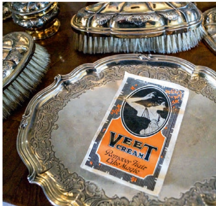
Hårfjerningscreme af mærket Veet fra 1925.

En sammenkrøllet regning fra det elegante københavnske stormagasin Fønnesbech, der på bagsiden definerer sig selv som værende et "Special-magasin for Dame-Ekvipering", vidner også om indkøbet af