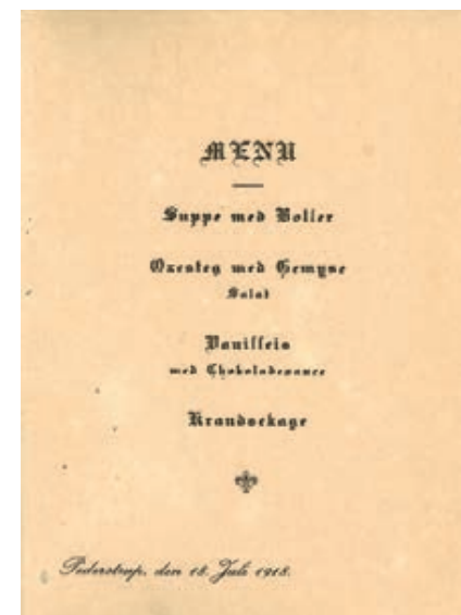
Menukortet fra festen den 18. juli 1918 afslører middagens sammensætning, der dækkede over tre retter med efterfølgende kransekage. Det fornemme kort, der på forsiden var dekoreret med grevskabets to hovedbesiddelser – lensgreveparrets sommerresidens, Pederstrup , og hovedsædet, Christianssæde – blev af flere gæster taget med hjem og sirligt gemt som minde om den storslåede fest.

Gennem avisartiklerne er det muligt at få et præcist indblik i festlighederne gang. Superlativerne stod nærmest i kø i reportagerne, der alle som en understøttede opfattelsen af, at der ikke blev sparet på noget. En "... storstilet Fest ..." 17 sat i ramme på et smukt dekoreret Pederstrup , der alene ved sin udsmykning må have gjort et uudsletteligt indtryk på gæsterne og været et tydeligt vidnesbyrd om de investeringer, som lensgreveparret havde bekostet for at sætte jubilæet i scene. De "... flere Tusinde kulørte Lamper. Der var bragt Lys-Buer i Alléer og Gange,