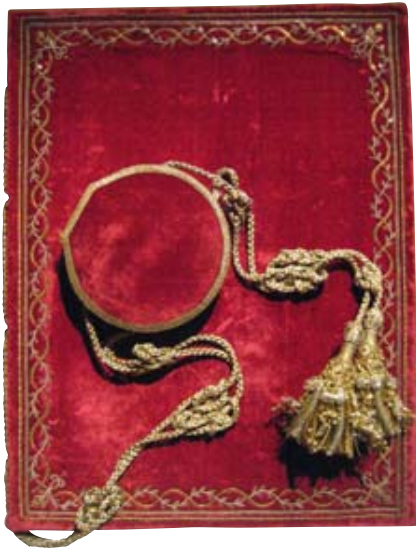
"Erections-Patent" for grevskabet Brahesminde, dateret "Kiøbenhavn d 9de Maj 1798". I familiens varetægt.