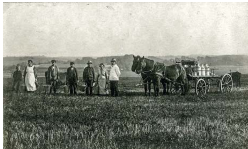
Et afgørende spørgsmål for husmændene var, hvorvidt det var nødvendigt at supplere indtægten fra husmandsbruget med arbejde uden for hjemmet. Mange husmandskoner tjente ekstra ved at malke for herregårdene eller de store bondegårde.

Betegnelsen husmand har gennem historien dækket over vidt forskellige tilværelsesformer, og tidligere var en stor del af de danske husmænd jordløse landarbejdere, der var afhængige af lønnet arbejde på herregårde eller bondegårde og således udgjorde en vigtig arbejdsreserve i det sæsonbetonede landbrugsarbejde. 11 I årene 1900-1919 skete der imidlertid en række markante forandringer for danske husmænd, og jordspørgsmålet, forstået som behovet for en mere social retfærdig jordfordeling med nye husmandsbrug til det jordløse landproletariat, blev et markant tema i dansk politik. Det Radikale Venstre blev dannet i 1905 og fik hurtigt husmændene som trofast vælgerskare og mindske af økonomisk ulighed hos blandt andet husmænd som en grundpille i partiets politiske program. 12 I samme periode blev landproletariatets vilkår som noget nyt beskrevet literært, og Det Folkelige Gennembruds forfattere med blandt andet Johan Skjoldborg (1861-1936) i spidsen beskrev landproletariatets kritisable vilkår og manglende fremtidsmuligheder, 13 mens det konnotativt stærke ord "jordhunger", forstået som landproletariatets sult efter egen jord, blev bestemmende for hele sagens tone. 14 Den voksende husmandsbewægelse fik desuden national udbredelse i årene op til Lensaflysningen og søgte med sit alsidige fokus at hæve landbostanden både socialt, kulturelt og økonomisk. 15