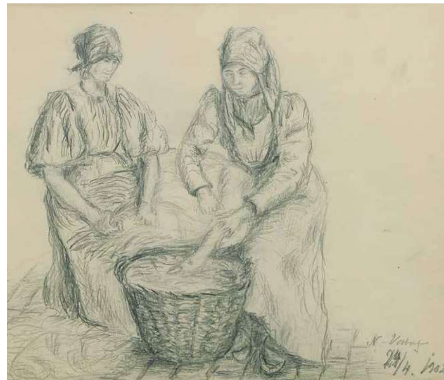
1800-tallets herregårdssruer var ledere af den omfattende daglige husholdning på herregården. Jo mindre herregården – og dermed staben – var, jo tættere var hun på de konkrete, praktiske opgaver. Skitse af køkkenpiger på Nørre Vosborg, der plukker fjerkræ omkring kurven. Ukendt kunstner, 1902.