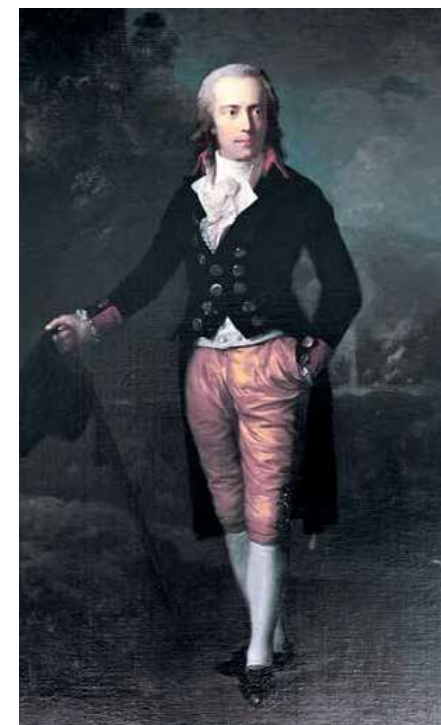
Hertug Christian Frederik af Augustenborg (1765-1814) og hans hustru, kronprinsesse Louise Augusta (1771-1843), malet i moderigtig klædedragt omkring 1790. Hertugparret kastede med deres besøg i 1789 glans over Brahetrolleborg. Også på andre herregårde lagde man vægt på at fremvise den gode forbindelse til kongefamilien – hertugparrets portrætter, som er gengivet her, pryder således i dag væggene på Gammel Estrup. Parret er malet af Anton Graff, 1790.