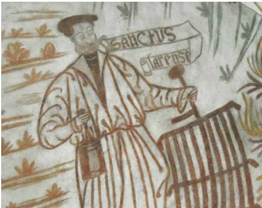
Sankt Laurentius var en populær helgen i Middelalderen. Kejseren i Rom krævede kirkens skatte udleveret, hvorefter Sankt Laurentius, der som ærke diakon skulle tage vare på disse skatte, kom anstigende med byens fattige. Derfor blev han brændt på bålet, angiveligt på en rist, som derfor er blevet hans faste attribut. Sankt Laurentius-billedet på kirkevæggen i Auning er anderledes end andre fremstillinger, idet han ikke ligner en typisk helgen. Det ses blandt andet af hovedbeklædningen, baretten, som er typisk for tidens adelsmænd. Billedet må derfor læses med en indbygget analogi, hvor Laurentius, som led martyrdøden på risten, i virkeligheden fremtræder som en adelsmand.