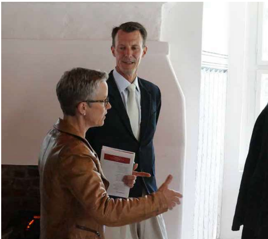
Museets protektor H.K.H. Prins Joachim åbnede udstillingen Herremandens Herregård i juni måned.