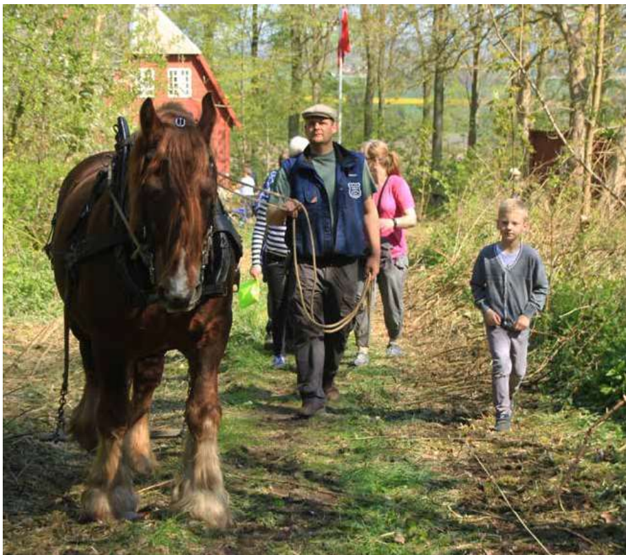
På Skovens Dag den 7. maj 2017 kunne man blandt andet opleve arbejdsheste, som skovarbejderne i herregårdsskoven Lunden før i tiden brugte til at fragte træ.