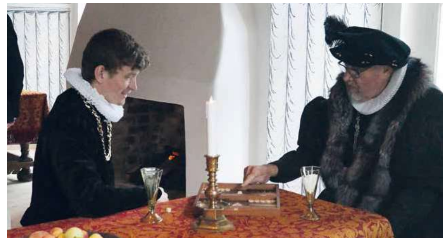
Fruerstuen var herskabets foretrukne opholdsrum i Renæssancen – og således ikke forbeholdt "fruer", men blev også brugt – som på billedet – af herremænd.

Mandag den 26. juni var en stor festdag for museet. Den dag åbnede museets protektor H.K.H. Prins Joachim udstillingen Herremandens Herregård , som viser livet for renæssancens adelsfolk. Udstillingen består af tre rum – Fruerstuen , Kapelgangen og Kapellet . I Kapellet kan man se, hvordan man på mange herregårde indrettede kapeller med særligt udsmykkede herskabsstole for blandt andet at demonstrere husherrens ophøjede rolle som den, der varetog husstandens religiøsitet og fromhed – både når gods-ejeren var "hjemme" på herregården og deltog i guds-