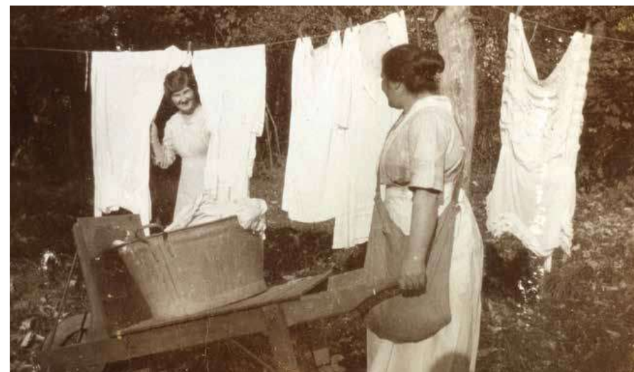
Ottilies fotoalbum fortæller meget om dagliglivet og arbejdet for herregårdens tjenestefolk, som for eksempel når der skulle vaskes storvask.

Takket være støtte fra Skibsreder Carsten Brebøls Almennyttige Fond og Slots- og Kulturstyrelsen kunne museet i 2017 købe et meget smukt toiletgarniture fra 1920'erne. Toiletgarnituret består af 12 dele – et stort spejl, en børste, et håndspejl, et par lysestager og en række små dåser og flasker til creme og parfume. Alle dele er fremstillet i forgyldt sølv i nyrokostil – en stilart, der blev særligt populær fra sidste del af 1800-tallet. Nyrokosten blev af tiden betragtet som særligt feminin og blev derfor navnlig anvendt til møbler og genstande i rum, som man mente hørte til den feminine sfære, såsom dagligstuer, kabinetter med videre. Sættets dele bærer monogrammet LC efter Marie Louise Castenschiold, hvis kaldenavn var "Lila". Marie Louise Castenschiold blev født i 1901 og ægtede i 1920 Adolph Frederik Holten Castenschiold til Borreby . Den unge brud fik dele af det smukke toiletgarniture i morgengave, og de følgende år fik hun endnu en del af sættet som gave af sin mand på deres bryllupsdag. Sættet gik efterfølgende i arv til datteren Anne