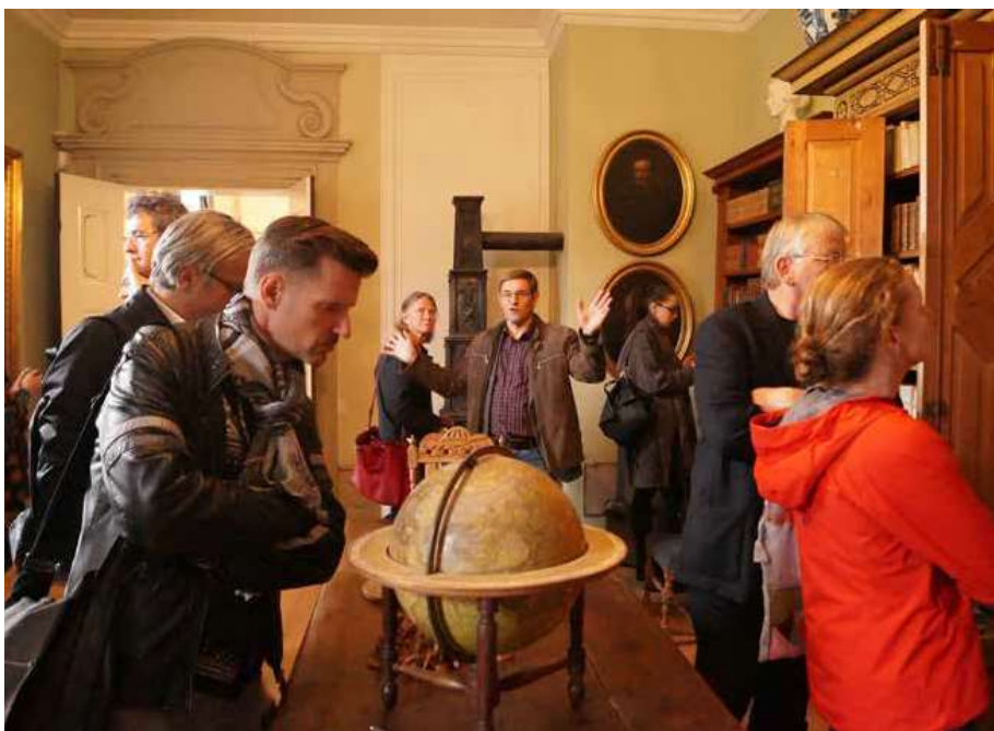
Deltagerne ved ENCOUNTER-konferencen var på ekskursion til en række herregårde, blandt andet Rosenholm Slot.

blevet gennemført etape for etape, således at museets besøgende i dag kan opleve historien fra 1500-tallet til cirka 1900. Ved udgangen af 2017 tilbage stod således kun én enkelt etape – fire rum på anden sal, hvor perioden fra 1900 til 1930 skal fortælles i 2018.