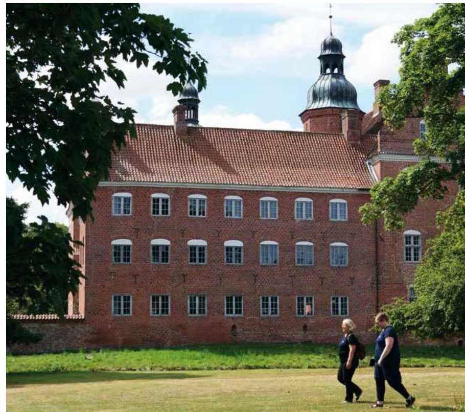
Gammel Estrups imponerende hovedbygning og en del af det omkringliggende kulturmiljø.

Med årets afslutning udløb også valgperioden for museets bestyrelse, idet medlemmerne følger valgårene for kommunal- og regionsrådsvalg. Museets bestyrelse udstikker de overordnede rammer for museets arbejde og ser til, at økonomien og dermed budgettet overholdes uden for mange og for store udsving.