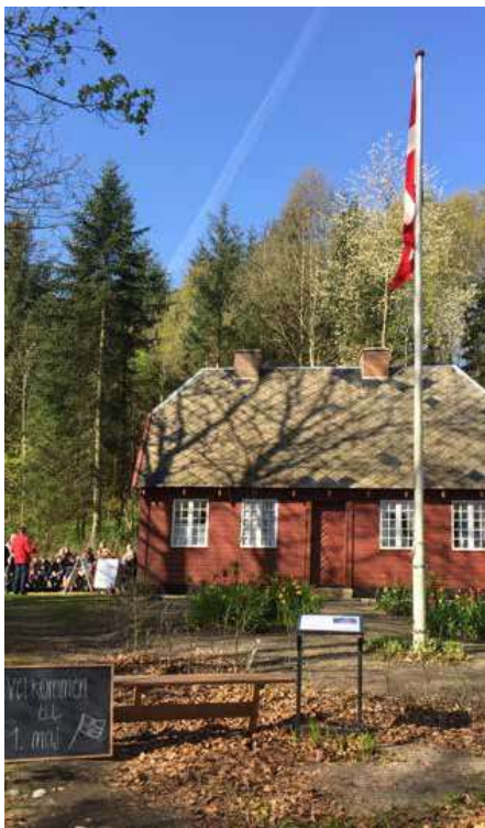
Ved Skovarbejderhuset fortælles historien om herregårdens jordløse arbejdere – også første maj, hvor der i 2017 var arrangeret en særlig skovarbejderdyst.