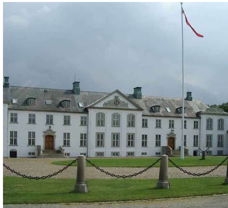
Gammel Estrup har blandt andet indsamlet tekstiler fra godset Lerchenborg.