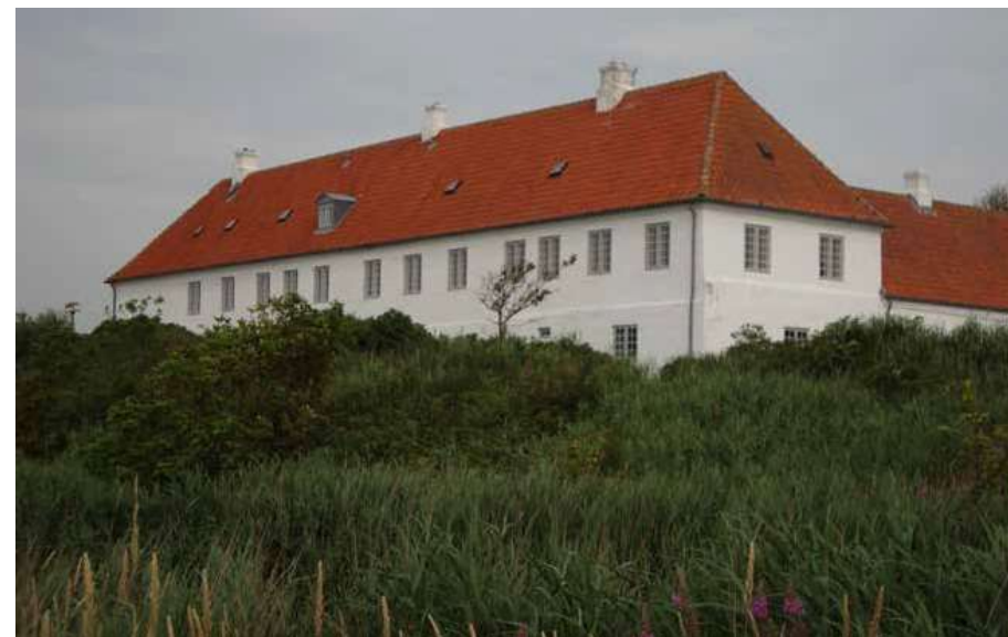
På en række busture kunne publikum opleve de danske herregårde. En af turene gik blandt andet til Rysensteen ved den jyske vestkyst.