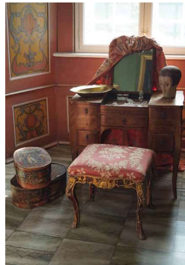
I 2017 indsamlede museet en parykkasse fra 1700-tallet (på gulbet, yderst til venstre). Kassen står nu i Påklædningsværelset, der er en del af Grevindens Elegante Gemakker på herregårdens første sal. Påklædningsværelset var grevindens private rum, hvor hun – med hjælp fra sin personlige kammerpige – iførte sig stor kjole, pudder og eventuelt paryk.

Tiden efter Reformationen var den periode, hvor dansk adel for alvor manifesterede sin position som rigets førende stand økonomisk, kulturelt og socialt. Til standens nye førerposition hørte også rollen som ”troens vogter”, og det kom blandt andet til udtryk i herremændens kirker, som blev udsmykket med slægtens våbenskjold, gravmonumenter, epitafier med videre. Gennem udsmykningen af sine kirker havde herremænd muligheden for at vise, at han kerede sig om religionen og således var værdig til at lede folket. Mange herremænd havde, ligesom ejerslægten på Gammel Estrup , et kapel i hovedbygningen, hvor herskabet og deres ansatte kunne udøve deres religion. Kapellet viste, dels at herskabet selv var fromt og troende, dels at herremænd sørgede for at give medlemmerne af sin husstand muligheden for at udøve deres religion. Det var denne historie om adelen fremtrædende samfundsrolle i Renæssancens Danmark, museet vil fortælle i de tre rum i stueetagen.