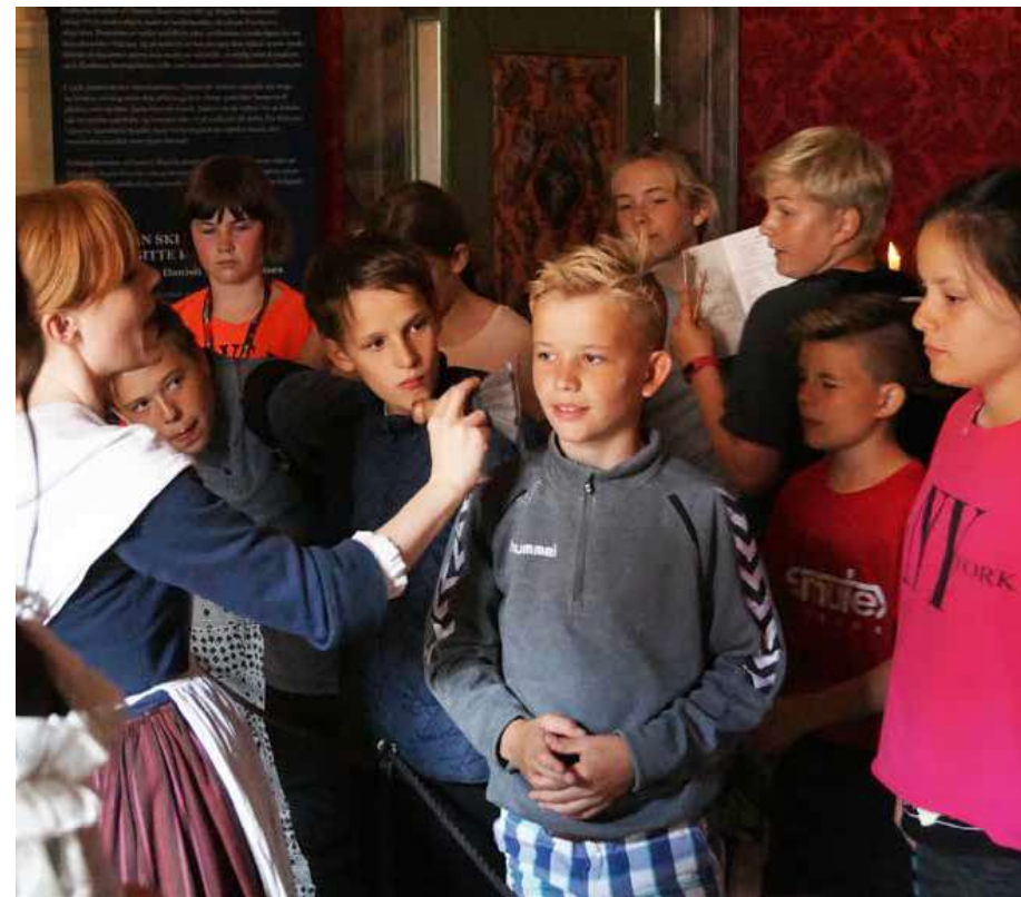
Gammel Estrup satser med stor succes på formidling til børn og unge. Her deltager en klasse i et skoleforløb om 1700-tallet med fokus på sanseoplevelser.

Fra den 26. juni til den 13. august var der sommerferieaktiviteter på museet, hvor man – med udgangspunkt i ombygningen af Gammel Estrup på Eske