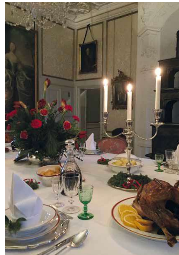
Udstillingen Jul for herskab og tjenestefolk viser blandt andet herskabets julebord anno 1918, hvor kalkun, brunede kartofler, asier og brun sovs udgjorde hovedretten efterfulgt af risalamande.