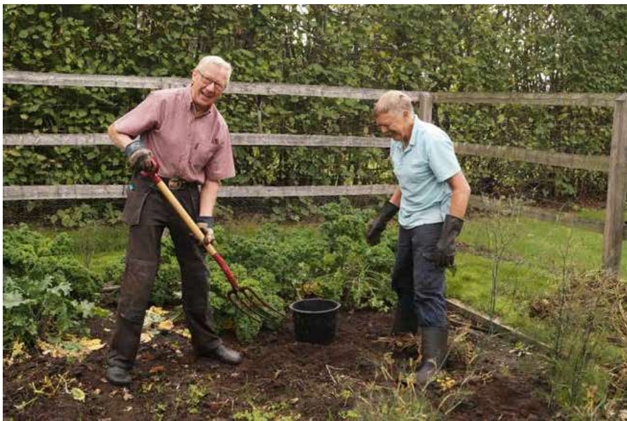
De frivillige lægger et kæmpe arbejde på Gammel Estrup. Blandt andet bliver køkkenhaven passet af en frivillig havegruppe.