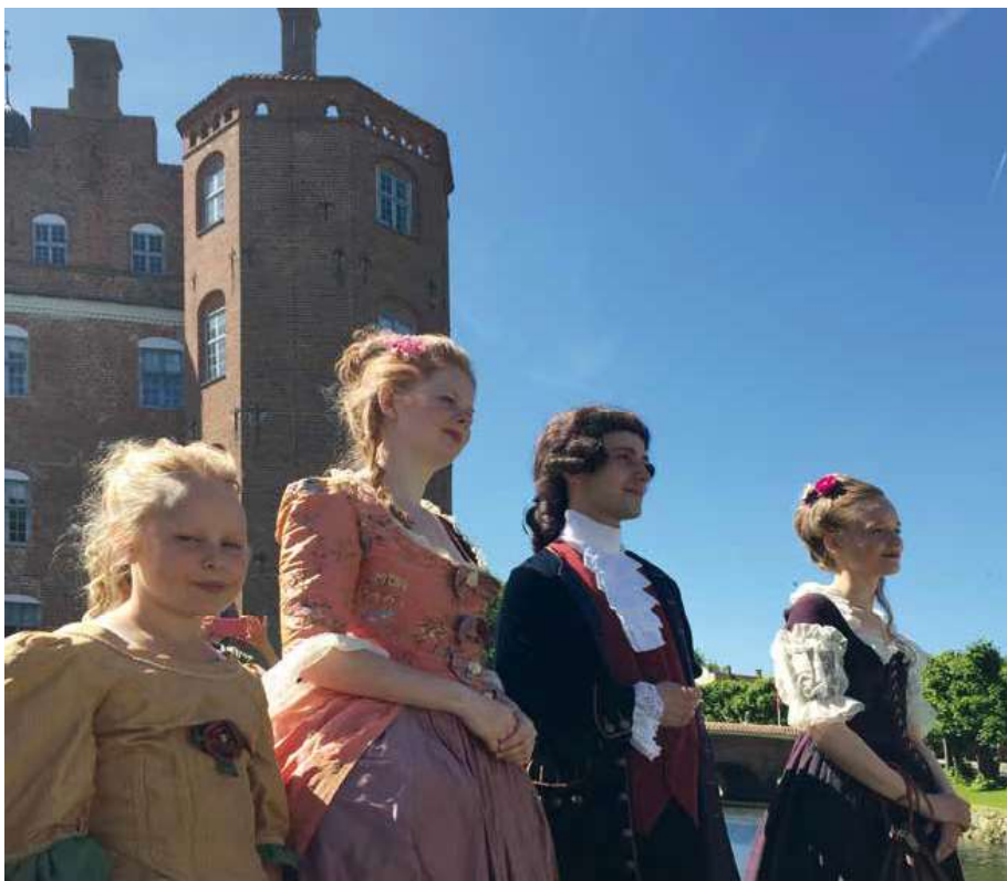
1700-talsfestivallen havde fokus på herregårdenes europæiske forbindelser – unge adelsfolk rejste blandt andet over landegrænser på dannelsesrejser. Her ses nogle af de mange unge studerende og frivillige, som deltog i levendegørelsen.

som selvforsynende enhed med æblemøsteri i Orange-rieme og konservering af råvarer fra herregårdshaven efter Ottilies Kogebog i Herregårdskøkkenet .