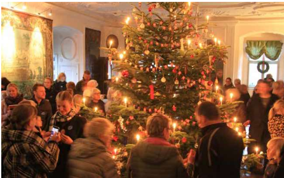
Det er efter flere års indsats lykkedes at skabe en vigtig sæson for museet omkring jul, hvor mange lokale valfarter til herregården – den rigtige julestemning indfinder sig først, når man har smagt en julesmåkage fra brændekomfuret og fået en dans om det store juletræ i Riddersalen!

tjeneste og julemiddag på traditionel herregårdsvis anno 1918. I slotskapellet satte herrerne sig således i den ene side, men kvinderne sad i den anden. Herskabet sad naturligvis i herskabsstolene, mens gæster og tjenestefolk placerede sig i stolene bagved. Selvom der var forskel på julen for herskab og tjenestefolk – både med hensyn til julemenu og gaver – fik alle dog