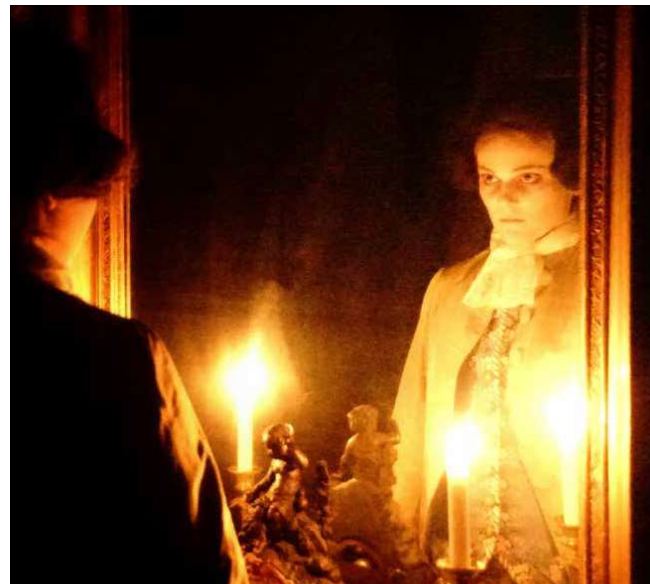
På allehelgensaften den 31. oktober kunne man opleve formidlingen af de spøgelseshistorier og sagn, som knytter sig til Gammel Estrup.

Lørdag den 23. december kunne de besøgende prøve noget helt særligt, da der blev holdt juleguds-