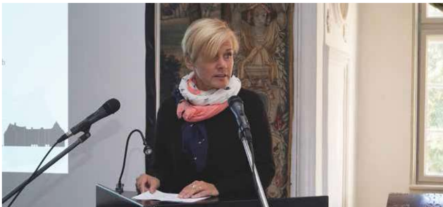
Kulturminister Mette Bock åbnede ENCOUNTER-konferencen, der havde titlen A Manorial World.

tede waliske forskningscenter ønskede at lade sig inspirere af det danske forskningscenters erfaringer, og på baggrund af denne udveksling afholdes ENCOUNTER-konferencen i 2020 ved Bangor University i Wales.