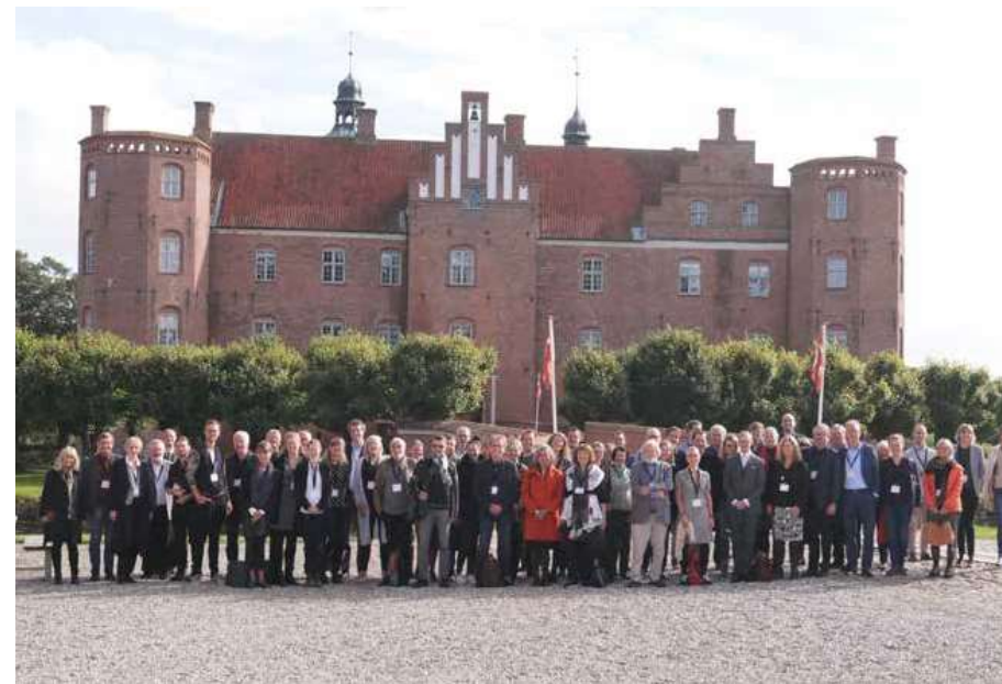
I 2017 afholdt Dansk Center for Herregårdsforskning en stor international konference i regi af ENCOUNTER (European Network for Country House and Estate Research) med over 60 deltagere fra ni europæiske lande.

På Gammel Estrup indsamles genstande og viden fra alle dele af herregårdskulturen – både inde og ude og oppe og nede. Der indsamles således både fra herskabets og de ansattes verden – det vil sige i hovedbygningen og den omgivende prydhave og fra