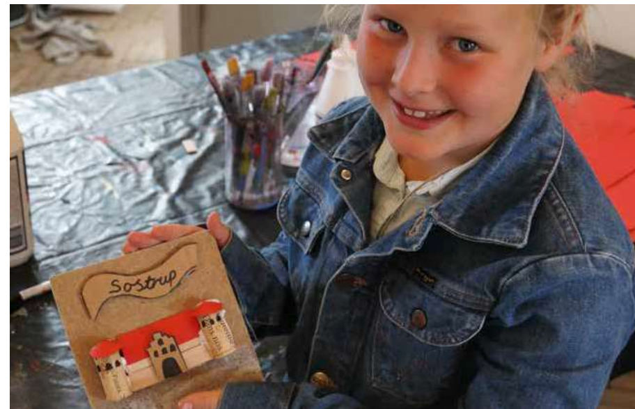
Børn og barnlige sjæle kunne bygge borge af genbrugsmaterialer i sommerferien. Pigen på billedet har bygget Sostrup af korkprop- per og pap.

Brocks tid for 400 år siden – kunne forsøge sig som bygmester og bygge en minimodel af Gammel Estrup af genbrugsmaterialer.