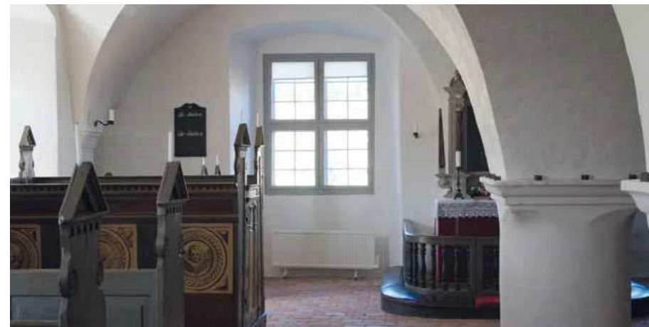
Kapellet blev restaureret i foråret 2017, hvor stengulvet blandt andet blev rettet op, og altertavlen blev rensset. Foto: Gammel Estrup Danmarks Herregårdsmuseum.

Foto: Gammel Estrup Danmarks Herregårdsmuseum.