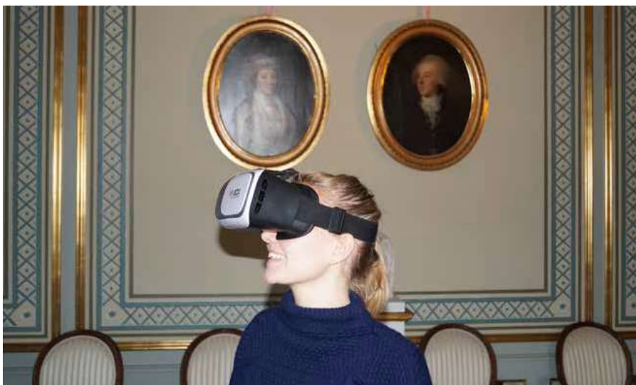
Museet var en del af Danmarks Radios store satsning Historier om Danmark, og Gammel Estrup var blandt andet kulisse til en af DR's virtual reality-film, som man kunne opleve i 3D med særlige VR-briller.

til den yngre målgruppe, og det er en fornøjelse at se, hvordan børn og unge kommer feststemte og udklædte til allehelgensbesøg på museet. Til dette års arrangement blev iværksat en række nye tiltag – såsom nyformidling af Gammel Estrups spøgelseshistorier i herregårdens kælder samt en stemningsfuld lyssti rundt i herregårdshaven.