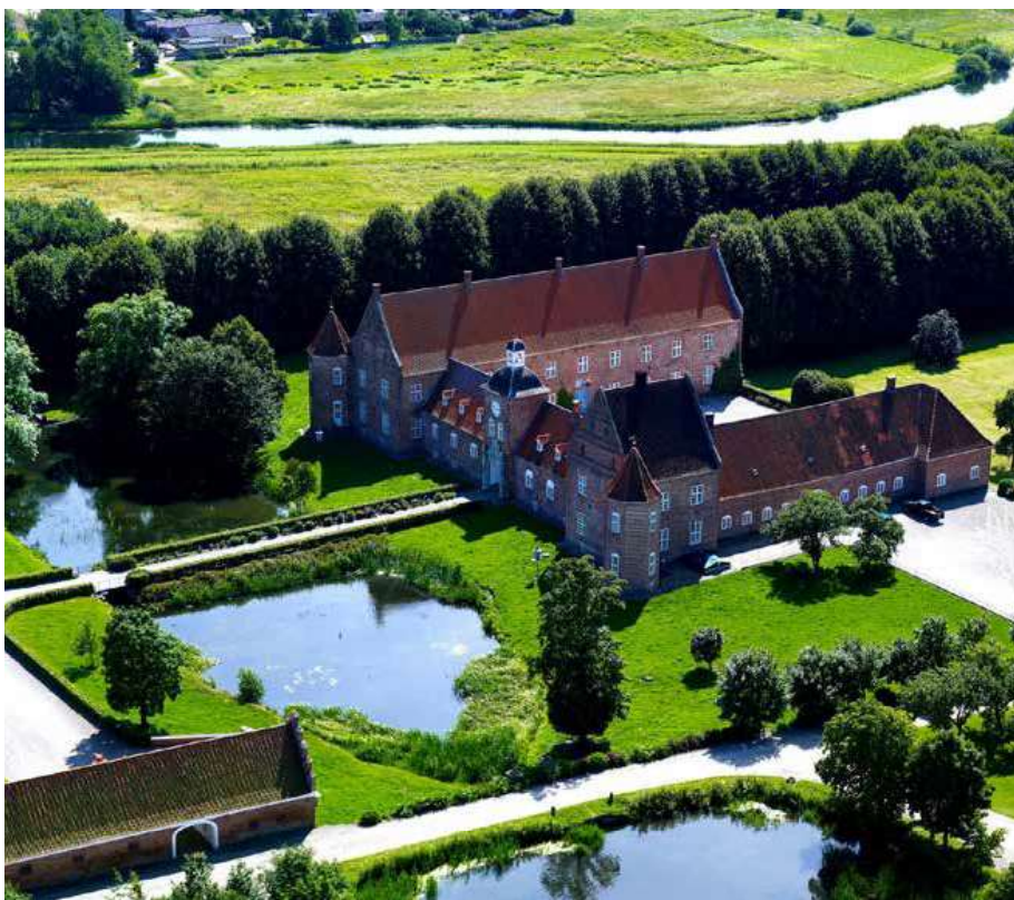
Herregården Ulstrup var i 2017 emne for en arkivalsk undersøgelse forestået af Dansk Center for Herregårdsforskning.

danskeherregaarde.dk, der har 700 daglige brugere og fungerer som et opslagsværk, hvor alle de danske herregårde findes omhyggeligt beskrevet til forskellige tider. Med udgangspunkt i enkelte herregårde i Region Midtjylland beskriver herregårdskortet.dk forskellige temaer og vigtige aspekter af dansk herregårdshistorie og -kultur. Målet med herregaardskortet.dk er at nå ud til et bredt publikum, og hjemmesiden har, sammen med de andre digitale satsninger, slået Gammel Estrups position som førende inden for herregårdsforskning og digital formidling af herregårde fast.