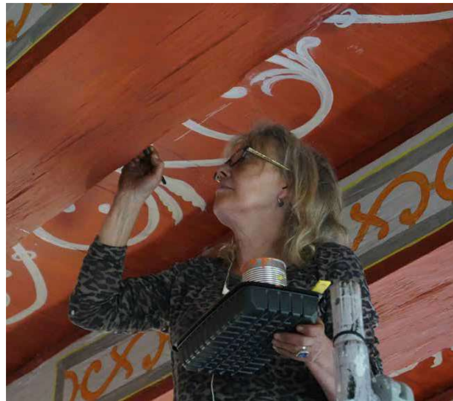
Loftet i Fruerstuen i stueetagen blev i 2017 bemalet efter forlæg, som var fundet under stukloftet i Riddersalen på første sal.

Det var imidlertid ikke udelukkende genstande fra Renæssancen, der blev restaureret i det forløbne år. To meget fine rokokostole fra midten af 1700-tallet stod også for tur. Stolene havde i flere år ikke været egnede til udstilling, men i 2017 lykkedes det atter at bringe stolene til ære og værdighed. De blev ombetrukket med et meget smukt grønt silkebetræk i høj kvalitet, sædet blev repareret, og træet på stolens ben, ryg og armlæn, der var blevet tørt og glansløst, blev frisket op. Stolene er i dag udstillet i Svendegangen , som hører til museets udstillingsafsnit om Gammel Estrup ved midten af 1700-tallet, Grevens Appartement .