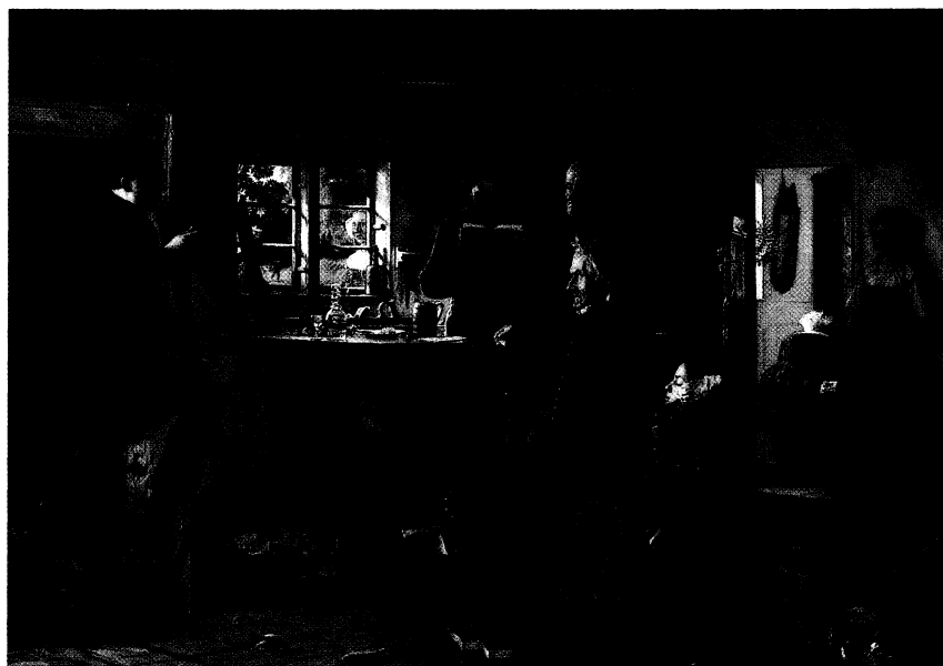
Mormoner på besøg hos en tømrer på landet. 1856. Olie på lærred, 79x110,5 cm. Statens Museum for Kunst