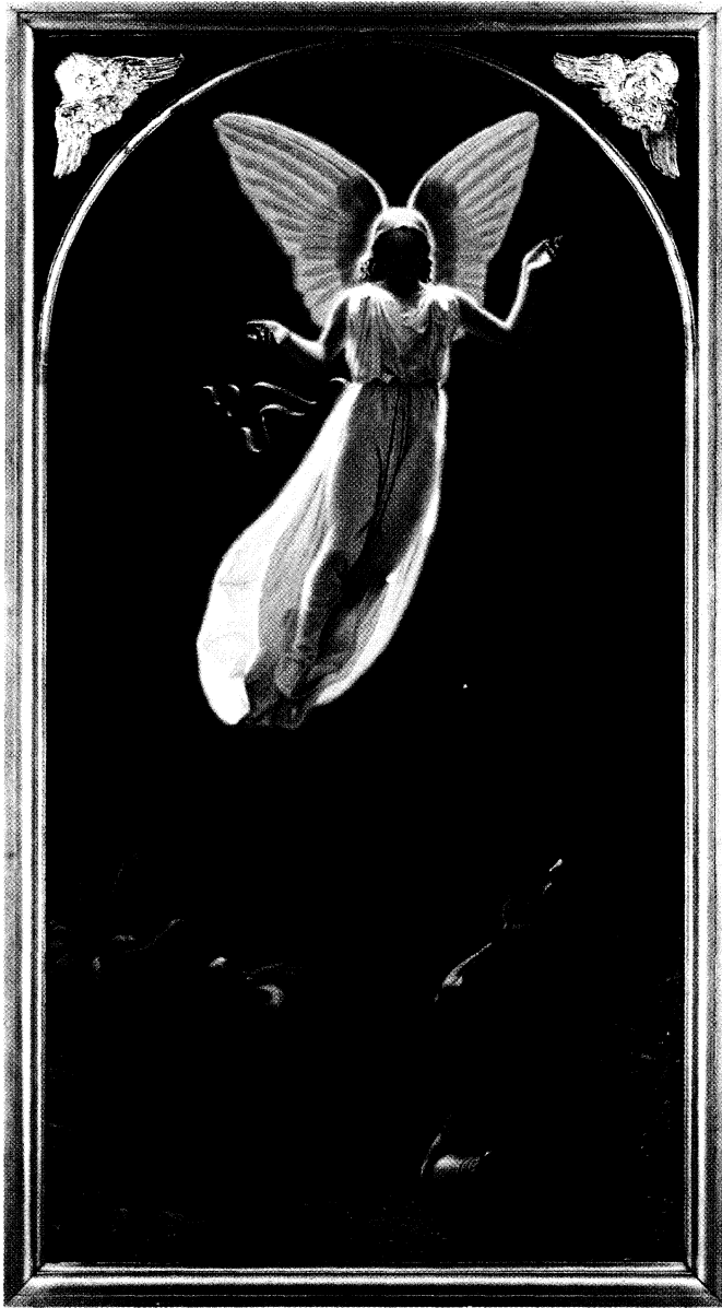
»Englene som forkynder Hyrderne Kristi Fødsel«. 1855. Malet til Skive Kirke, tilhører nu Skive Museum.