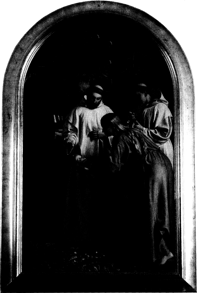
Det lille dåbsbarn, klædt i rødt, kigger op på krucifikset, som Ødbert holder over dåbshandlingen.