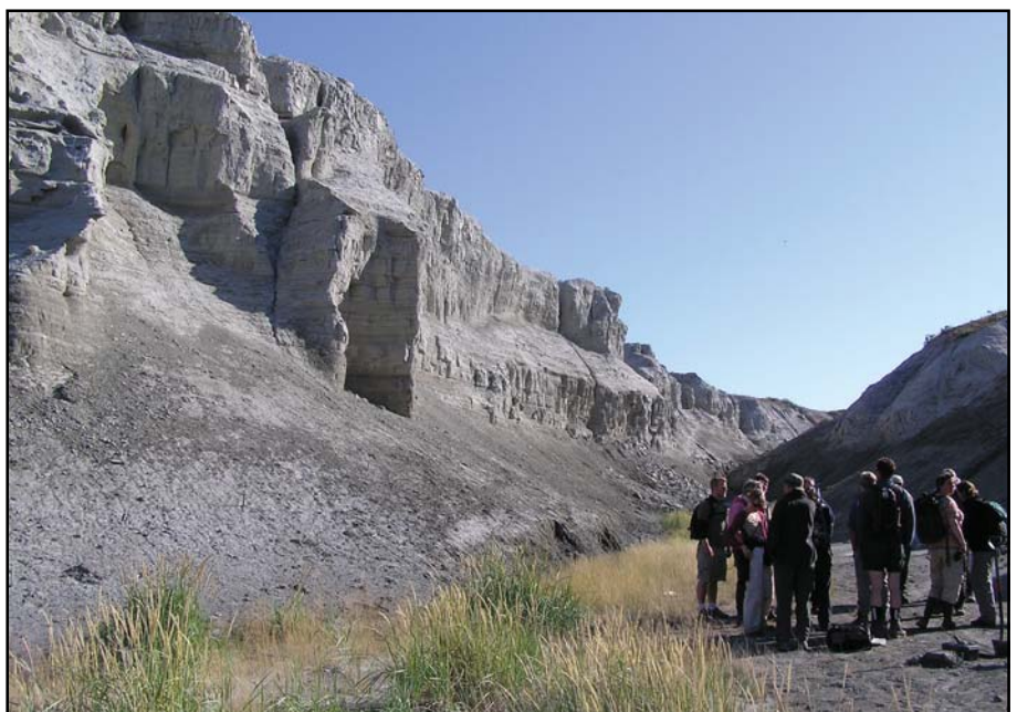
Ved Kangerlussuaq findes hævede marine sedimenter med fossiler af fisk, muslinger og grave-gange. En del af kursets feltarbejde bestod i opmåling af disse aflejringer.

Ved bredden af smeltevandsløbet i Sandflugtsdalen ses siltede og sandede aflejringer. Det er de fineste af smeltevandssedimenterne, der kan transporteres af vinden. I det kolde klima er vegetationen sparsom, og der er derfor ikke noget til at holde på sandet, som aflejres i klitter. Det er den samme type klimabetingede indlandsklitter, man kan se ved Råbjerg Mile, der blev anlagt i "Den lille Istid" i 1500-tallet, og samme type klimabetinget flyvesand som dækkede Vikingegravpladsen ved Lindholm Høje ved