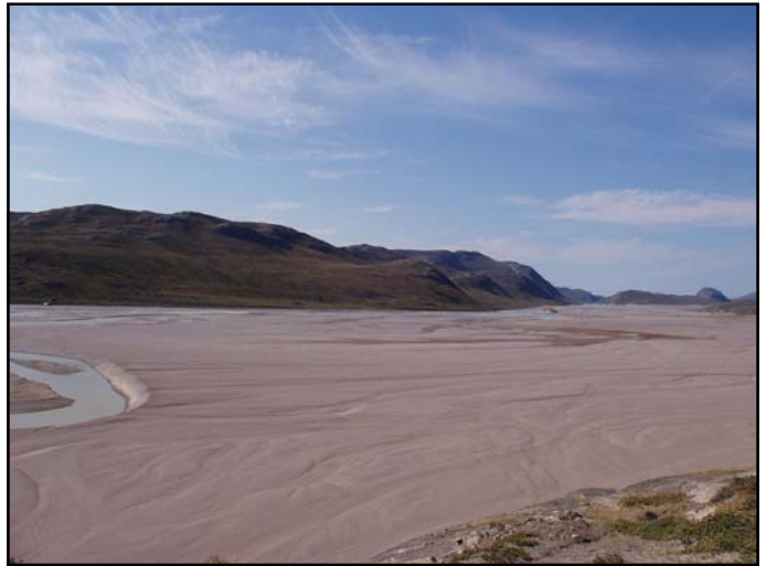
Længere nede ad smeltevandsystemet dannes den flade smeltevandslette med terrasser, som viser ændringer i erosionsbasis. Materialerne herpå er eksponeret for de kolde faldvinde fra Indlandsisen og er vind-slebne. Niveauforskellen mellem fladen og det nuværende flodløb til venstre i billedet er 5-7 meter.

isen, ligger spredt på isen og langs isranden. Langs isranden ses også sammenskubbede moræner, der indeholder alle kornstørrelser op til kæmpe klippeblokke. Fint materiale og sten smelter fri fra isens shearplaner og ligger i lange bånd oven på isen. Foran isen skubbes alt dette materiale op i randmoræner, som sammen med begravede dødiseblokke danner et kaotisk bælte i randen af gletscheren. De samme kræfter, vi ser her, er dem, der for mange år siden dannede vores randmorænelandskaber i for eksempel Den Jyske Ås, i området nordøst for Sæby og nord for Hjørring, og som efterlod store sagnomspundne klippeblokke spredt i hele landet.