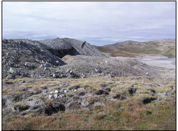
Dødisområde i kanten af Indlandsisen. Under de tilsyneladende store dynge af grus og sten er der ikke langt ned til den døde is. Faktisk ligger ren gletscheris lige under overfladen isoleret af det materiale, som er smeltet ud af den.

gerne omfattede bachelorer, ph.d.studerende, lektorer og ansatte fra Aarhus Universitet, geologer fra Sønderjyllands, Ribe, Ringkøbing, Vejle, Århus og Nordjyllands Amter samt enkelte geologer ansat i det private.