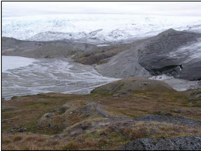
Smeltevandet løber fra den sammenstyrtede gletscherport til højre i billedet mod venstre, og der dannes en smeltevandskegle med en flettet flod ovenpå foran gletscheren. Smeltevandskeglen udbygges i søen, som opfyldes af grove sedimenter. Om vinteren, når søen er frosset, afsættes finkornede sedimenter i varvige lag på søens bund.