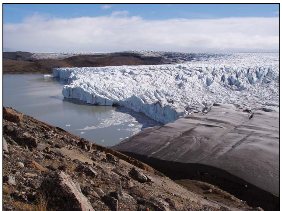
Isdæmnet sø som med et par års mellemrum tømmes. Tømningen sker, når vandtrykket i søen er højere end vandtrykket i gletscheren, og bevirker, at gletscheren løftes fra sit underlag. Søen kan tømmes ind under gletscheren i løbet af 36 timer i et voldsomt Jökulløb.

Overalt i området ses eksempler på de enorme kræfter, som gletscheren rummer. Store klippeblokke, der er transporteret med