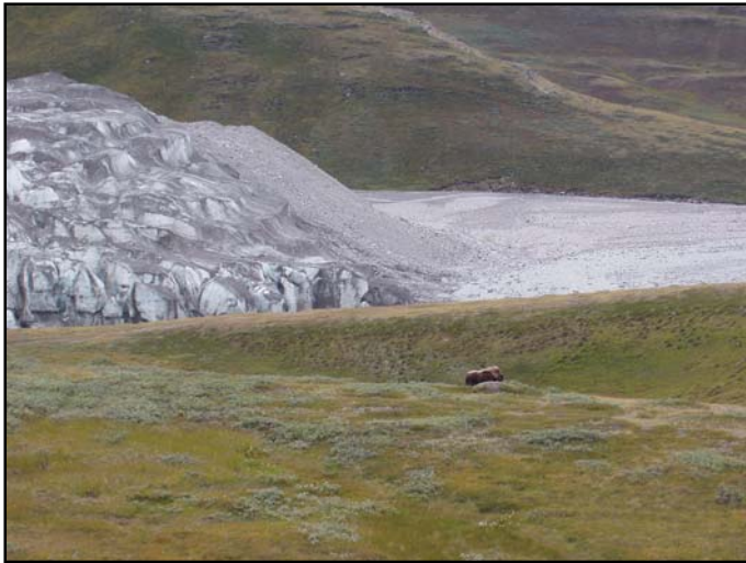
Randmoræne af sten, grus, sand og silt foran Russells Gletscher samt en moskusokse. Isen er beskidt pga. afsmeltning i sommermånederne. For tiden er gletscheren under fremrykning.