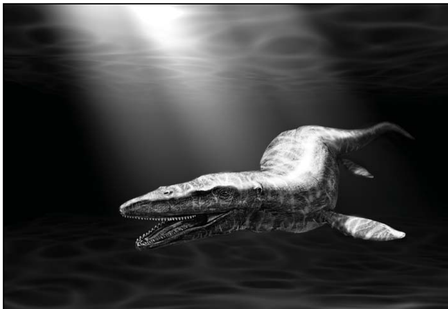
Rekonstruktion af den ca. 3 m lange Halisaurus sternbergi . (Billedet er lavet af Javier Herbozo)

Goddins lykke kom dog ikke til at bestå. I efteråret 1794 marcherede en fransk armé under general Klébers kommando ind i det sydlige Holland, og Maastricht kom under belejring. Fortet Sint Pieter udsattes for heftig beskydning, medens Goddins nært beliggende gods blev skånet. De franske artillerister havde fået strikte ordre om til enhver pris at skåne kapellet, hvor det efterhånden berømte fossil blev opbevaret.