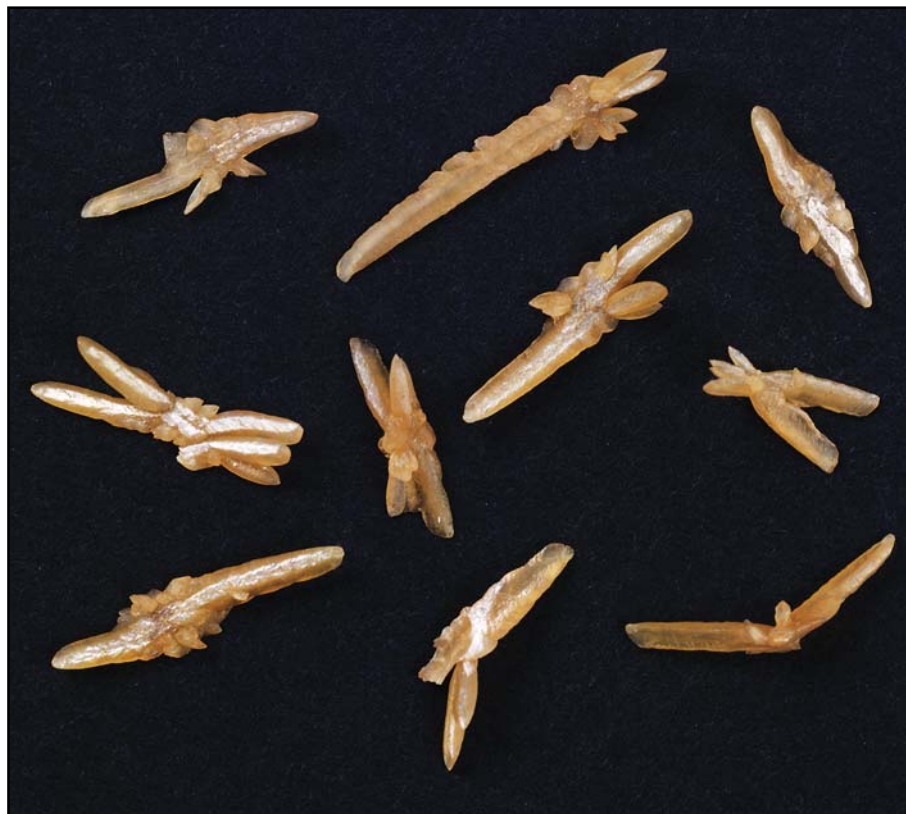
De fineste "vindruekrystaller". Men hvad består de af?

klubben og beundret, studeret i lup og under mikroskop, testet med uv-lys, ridset i, knust og smagt på, samt duppet med vand og saltsyre, men uden at mysteriet opklares. HVAD ER DET???