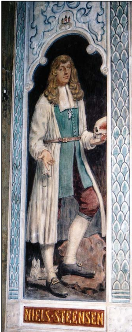
Emanuel Vigelands fresko på Københavns Rådhus.