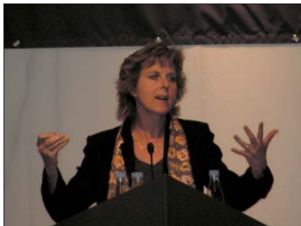
Connie Hedegaard talte varmt for ny miljøteknologi.