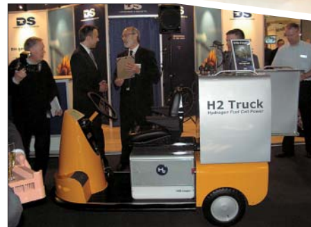
H2 Trucken vejer 450 kg og har en topfart på 15 km/t.

På Energistyrelsens stand kunne man få gode råd om solenergi og besparelser i længden i forhold til fossile brændstoffer.