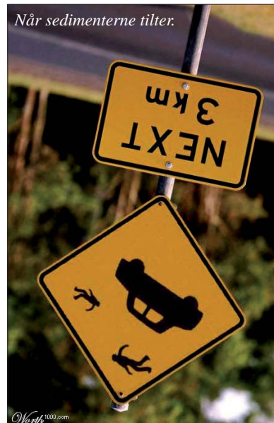
Når sedimenterne tilter.

Af GeologiskNyt's wbmaster Steen Laursen