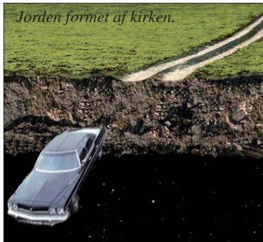
Jorden formet af kirken.