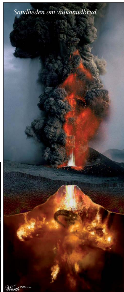
Sandheden om vulkanudbrud.