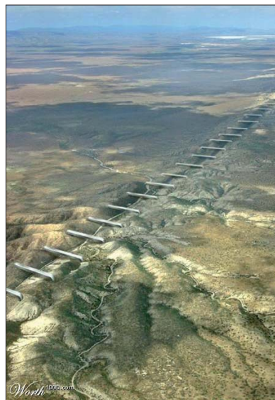
Hvordan kontinenter vokser sammen.