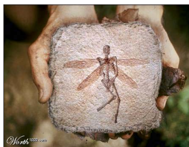
Vore forfædre fundet i moleret.

Hvilke processer bragte livet til Jorden, hvilke processer former Jordens overflade. Og hvis de virkede anderledes, hvordan ville Jorden så se ud? Spørgsmålene er mange og svarene få. Men når man kigger på Worth1000.com, får man klart på fornemmelsen, at computernørderne begynder med svaret og aldrig kommer til spørgsmålet. ■