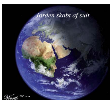
Jorden skabt af sult.