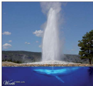
Hvordan geysere i virkeligheden opstår.