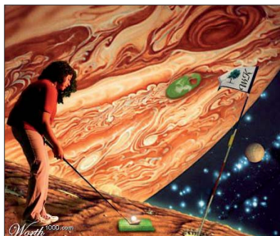
Hvordan livet spredes fra planet til planet.