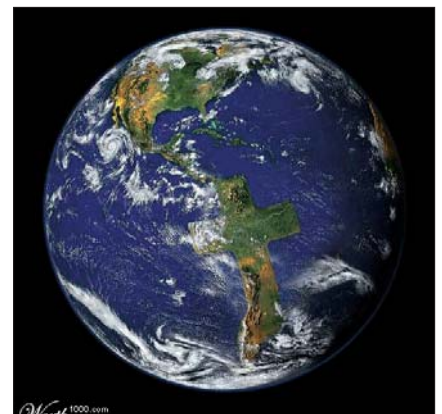
Skabte gud jorden? (Fotomanipulation: www.worth1000.com)

Så til vores temmeligt middelmådige spørgsmål har det store, intelligente internet altså svaret, at hjemmesider, som blander gud og geologi sammen, ikke har svaret. Og nu er der øvrigt nogen, der skriver “Geologi er gud” på internettet. Det gør GeologiskNyt, for vi lægger denne artikel ud til alle de andre på vores hjemmeside. Gud ved, om det betyder, om vi har svaret? ■