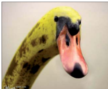
Er der en intelligens bag evolutionen?

svar på spørgsmålet. Her er et svar fra internettet. Forskydninger i Jordens skorpe udløser jordskælv, vulkanudbrud og tsunamier, og der er ingen vilje eller hensigt indblandet i det, foreslår en præst. Gud har simpelthen lavet naturlovene, og nu kører de så deres egne veje.