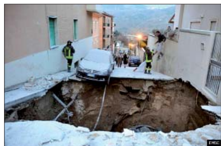
Ødelæggelser i L'Aquila 7 km fra epicentret.

For vores græske kolleger er diskussionerne