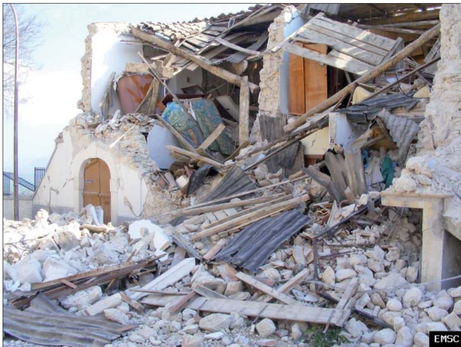
Mange huse var styrtet helt sammen i L'Aquila pga. jordskælvet.

Jordskælvsforudsigelse er stadig et meget aktivt forskningsområde, fordi det er samfundsmæssigt vigtigt i mange jordskælvs-egne. Man forsøger på den håndgribelige