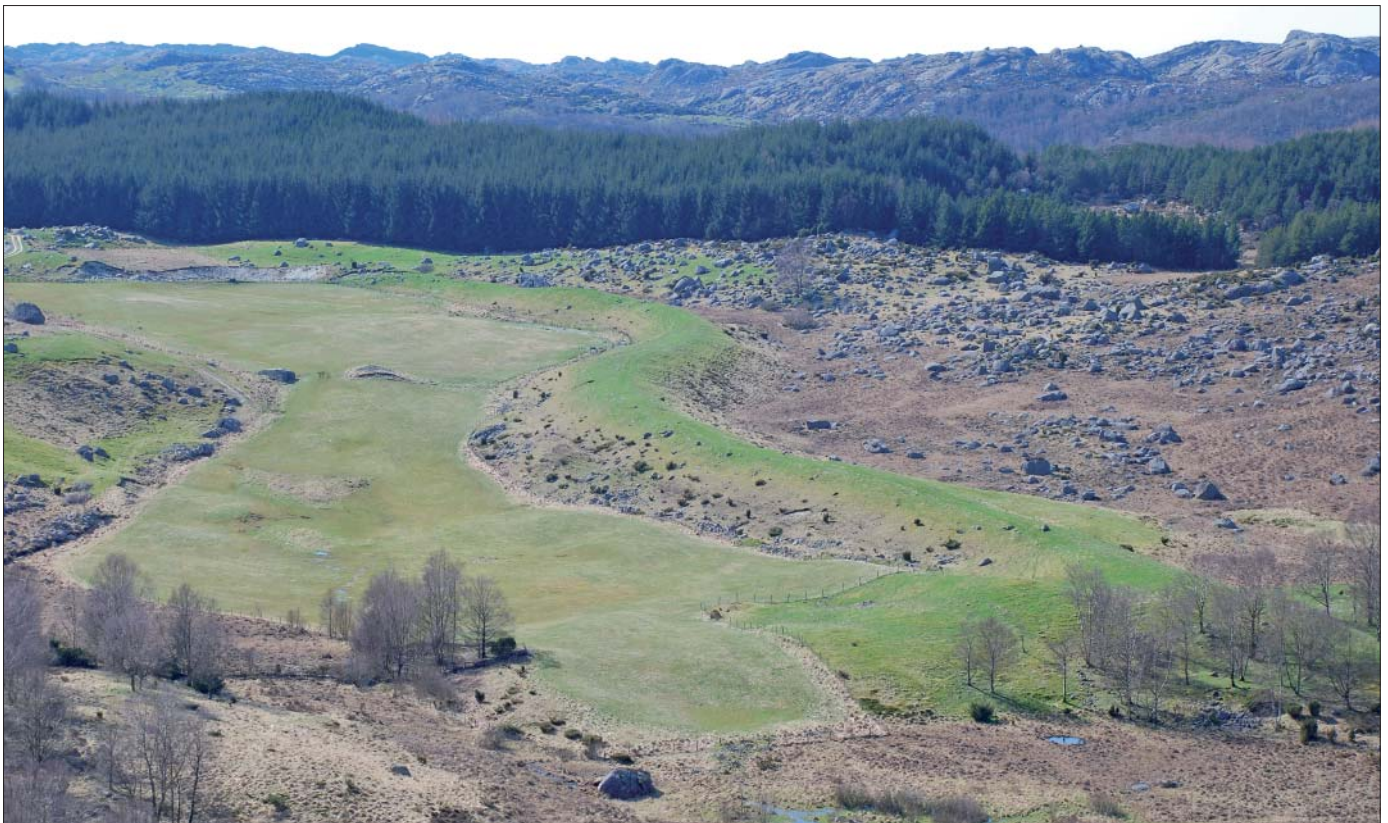
Den velbevarede esker "St. Olav's Orm" danner en markant ryg, der snor sig gennem landskabet. Til højre for "ormen" er overfladen dækket af mange vandreblokke; til venstre er blokkene blevet fjernet for at dyrke jorden.

bruges hovedsageligt i maling, plastik og papir, men også i solcreme, make-up og i