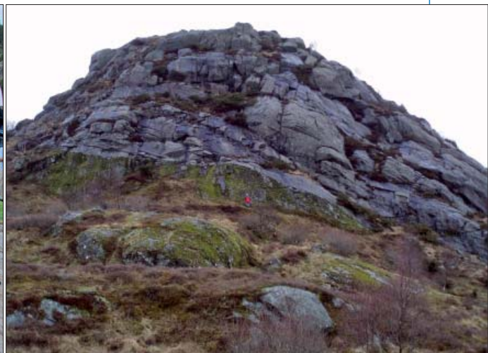
Den nedre grænse af bjergarterne dannet efter det sidste magmainfluks i den lagdelte Bjerkreim-Soknda-intrusion er blottet på Storeknuten. Gabbronoritiske bjergarter i toppen af MCU 5 (som er rig på mørke mineraler samt apatit) forvitret til mosdækkede overflader. Anorthosit i bunden af MCU 6 er meget fattig på mørke mineraler og har ingen apatit; den forvitret til vegetationsfrie overflader. Den skarpe grænse mellem MCU 5 og MCU 6 er synlig ca. 2 m over personen midt på billedet.

der Bjerkreim-Sokndal-intrusionen. Den dækker et område på 230 km 2 i MGP og har en længde på 40 km og en maksimal bredde på 15 km. Magmakammeret udviklede sig i 6 trin, hvor nyt magma blev intruderet i kammeret. Bjergartstyperne i den lagdelte intrusion dækker et meget stort spektrum fra anorthosit gennem troktoolit (der består af mineralerne olivin + plagioklas), norit (orthopyroksen + plagioklas), gabbronorit (orthopyroksen + klinopyroksen + plagioklas ± apatit), jotunit (olivin + orthopyroksen + klinopyroksen + plagioklas + alkali feldspat + apatit), mangerit (> alkali feldspat end i jotunit) til charnockit (en granit med orthopyroksen). Bjergarterne er ofte lagdelt på centimeterskala (foto øverst til venstre). Intrusionens lagdelte struktur betyder, at vi kan estimere tykkelser. Den totale tykkelse af intrusionen er >7.000 m. Taget til magmakammeret er blevet eroderet bort. Xenolitter (fragmenter af “fremmede” bjergarter) er almindelige i de lagdelte bjergarter. Disse repræsenterer fragmenter af taget til magmakammeret, der blev revet løs og sank ned gennem magmaet, til de nåede bunden – krystallisationsfronten. De fleste xenolitter er af gnejs. Det viser, at magamakammerets tag (som mangler nu) engang bestod af gnejsiske bjergarter.