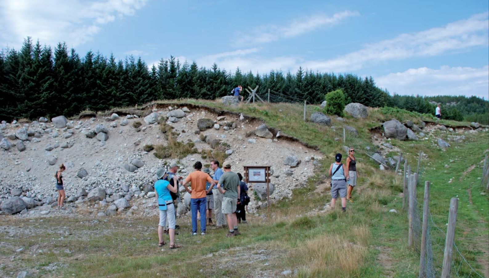
En grusgrav blottes et snit gennem St. Olav's Orm. Her kan man se, at ormen består af materiale med stor variation i kornstørrelse, fra blokke i meter-størrelse gennem grus og sand til silt. Udgravningen kan ses til venstre i billedet nederst på foregående side.

mange piller. Det indgår også i nogle madprodukter, hvor det er kendt som "E171".