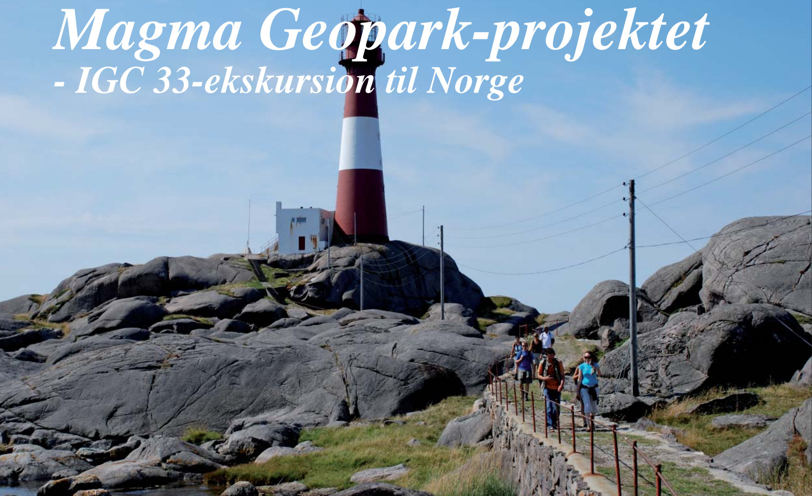
Eigerøy-fyrtårnet er bygget på anorthosit.