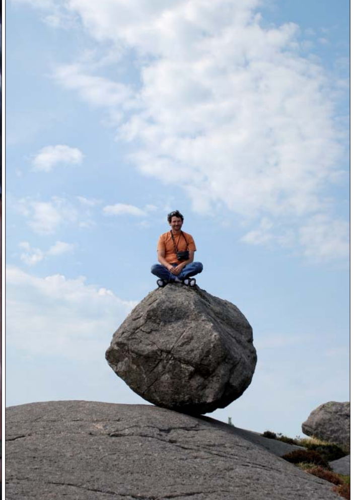
Venstre: Der blev forklaret og noteret flittigt samtidigt med, at bjergarterne blev undersøgt på tæt hold under ekskursionen. Højre: En russer bosat i Finland fungerer som skala på en vandreblokke i Sydnorge.

ilmenitmalm separeres. Bjergarten er en ilmenitmorit med ~30 % ilmenit. Ilmenit er