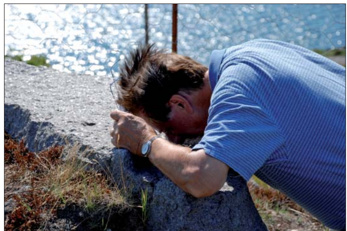
Anorthosit studeres intensivt under ekskursjonen.

er to store stenbrud vest for Egersund, hvor bjergarten er udvundet netop på grund af farvespillet. Blokke af massiv anorthosit, der måler ca. 3 x 2 x 1 m, bliver skåret ud med en roterende kabelsav – hvor “wiren” er imprægneret med diamanter (fotoet til højre). Blokkene sendes til Larvik til videre forarbejdning på samme måde som den lokale bjergartstype larvikit (som blev kåret som Norges “Nationale Bjergart” i 2008). Anorthosit fra Rogaland med farvespil sælges under navnene “Labrador Antique” ( www.granit.no ) og “Blue Antique” ( www.larvik-granite.no ).