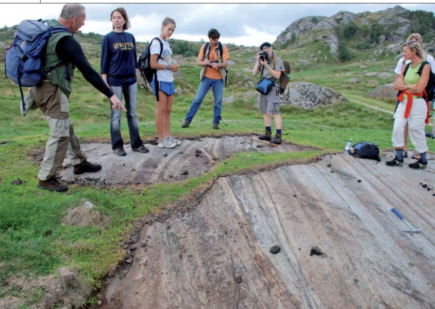
Lagdelt gabbronorit fra Bjerkreim-Sokndal-intrusionen. Stratigrafisk op er til højre. Brian Robins peger på en indeslutning af gnejs i midten af billedet.