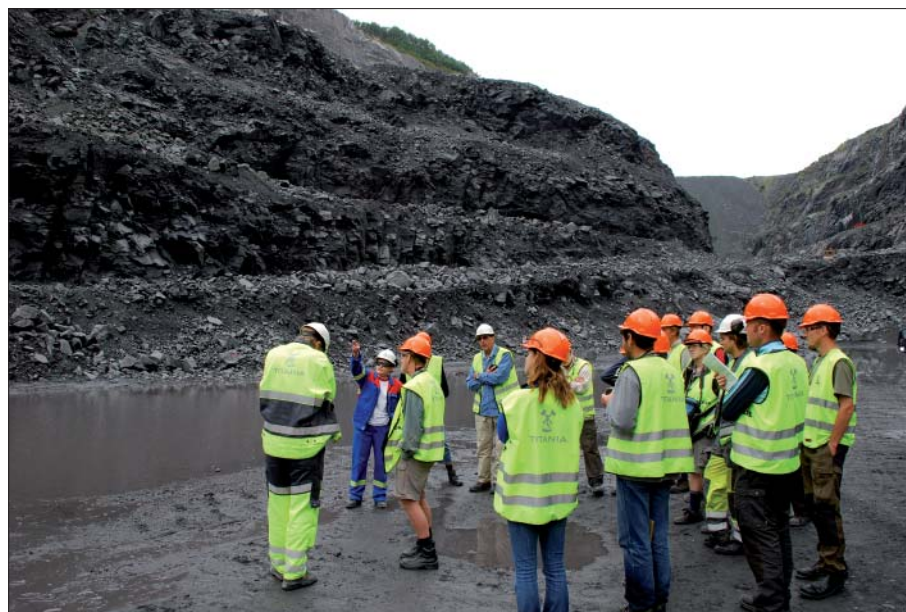
Ekskursionsdeltagerne i beskyttelsestøj kigger på den sorte ilmenitnorit, der giver det hvide produkt TiO 2 -pigment.

været rettet mod jern-titan-malme, men nikkel, kobber, molybdæn og wolfram har alle været vigtige igennem årene. Nu er der kun én aktiv mine i området (Tellnes) – men det er til gengæld den største titanmine i Europa (foto nedenfor). Udvinning af jern-titanmalm begyndte ca. 6 km øst for Egersund i 1785 fra nogle relativt små, men rige forekomster af mineralet ilmenit (FeTiO 3 ). Det var jern, der var af interesse til at begynde med – men det store indhold af titan gjorde, at det var svært at smelte. Senere var indholdet af titan det vigtigste. Tellnes er en “open pit-mine”, hvor hele bjergarten knuses, før