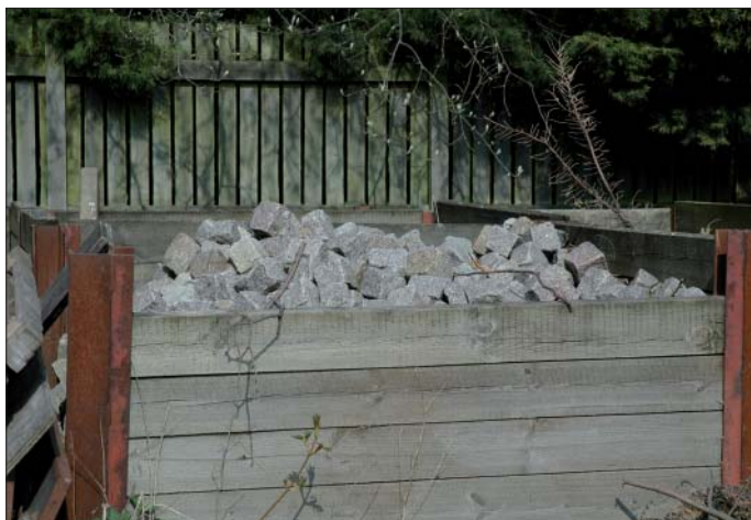
Oh ve – hovedlageret er fundet!

Af GeologiskNyts webmaster Steen Laursen