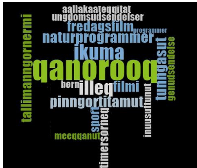
FIGUR 1. Udsendelser der interesserede KNR-TV's seere i februar 2022. Ordsky dannet af analyseprogrammet NVivo.

Blandt spørgsmålene om medieforbrug blev der spurgt ind til, hvornår på døgnet respondenterne mest ser tv i intervallerne kl. 08.00-12.00, 12.00-16.00, 16.00-20.00 og 20.00-24.00. Tidspunkterne er taget ud af KNR-TV's normale udsendelsestider. Lidt over halvdelen af deltagerne svarede, at de mest ser tv kl. 16.00-20.00, hvor der sendes børne-tv, forskellige typer genudsendelser – mest familievenlige – og nyheder, bl.a. den grønlandske tv-avis Qanoroq, der bliver sendt på hverdage kl. 19.00. Fire ud af fem af de adspurgte ser