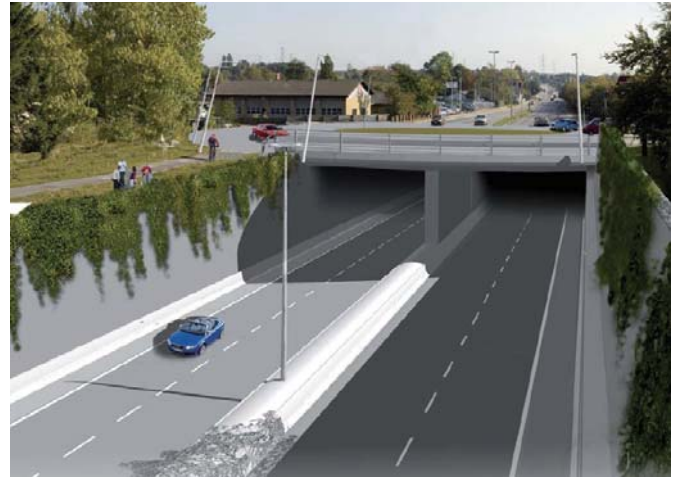
Figur 1. Eksempel på visualisering af ny vej gennem Stenløse fra VVM-redegørelsen: "Ny højklasset vej i Frederikssundsfingeren" (Vejdirektoratet, 2006)]

Den mest gængse form for visualisering i planlægningen er dog stadig streger på et kort. Traditionelt rummede kommune- eller regionplanen et antal kortbilag. Dem kunne læseren så folde ud og forsøge at tyde. Ofte var det svært, fordi et sammensurium