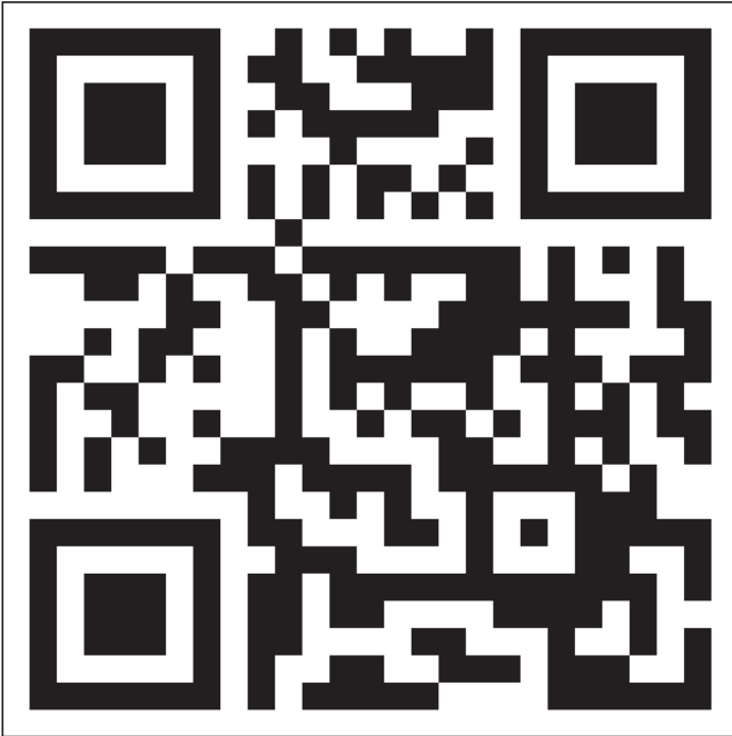
Figur 2. Eksempel på QR-kode, som en forbipasserende kan skanne med sin smartphone og derved ledes videre til eksempelvis applikation, her eksempel på den kommende Naturmobil-applikation, "Det naturlige Lolland", i Lolland Kommune. Illustration Bysted A/S.

meste restaurant eller toilet. Men det gælder også, når vi ønsker yderligere viden, om det vi ser, og der hvor vi står. Altså formidling om stedet på stedet.