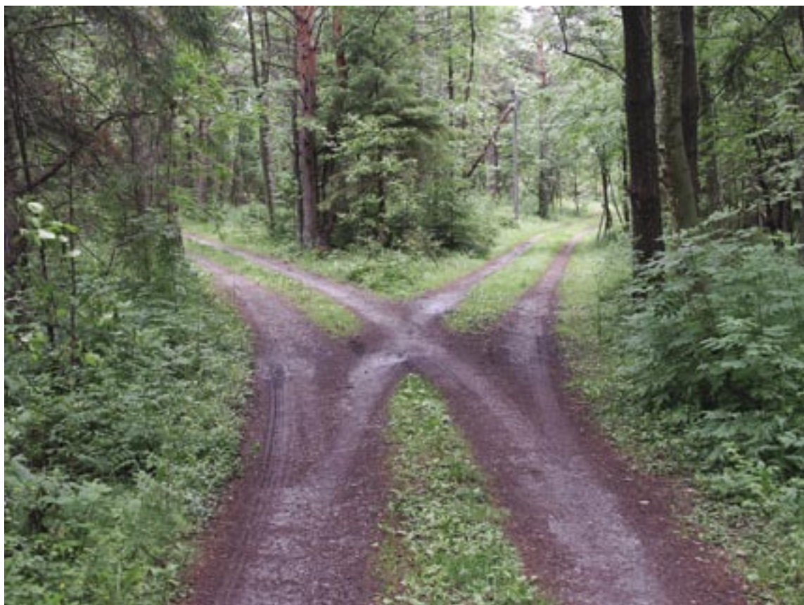
Bild 2 (vägskäl). "Vi hamnar ständigt i valsituationer. Varje arbetsgivare, lärosäte, förening och enskilda individer måste hjälpa till på sitt håll. Om vi väljer samma väg så har vi möjlighet att lösa problemen gemensamt."

Efter genomförd undersökning kunde vi konstatera att många organisationer står inför stora pensionsavgån-