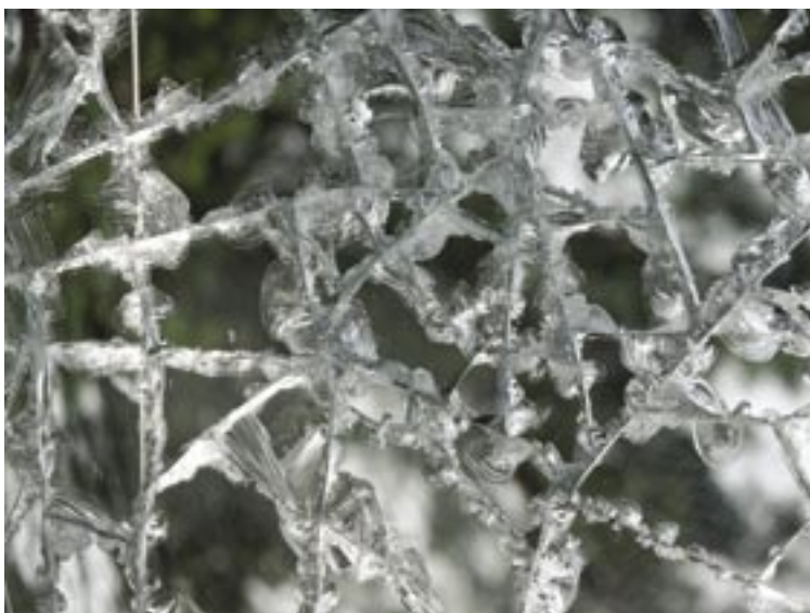
Bild 1 (spegel). "Utbildningarna inom geografisk IT i Sverige är mångfasetterade, men på grund av en decentraliserad och svårstyrd verksamhet blir det mer som en krackelerad spegel – det blänker okontrollerat"

De stora problemen dök upp när vissa högskolor insåg att deras rekryteringsbas endast var individer i högskolans närområde. På mindre orter decimerades rekryte-