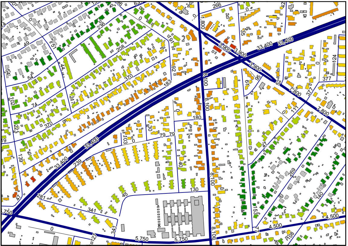
Figur 4: Udsnit af støjkortlægningen for Gladsaxe Kommune. Kortet viser den maksimale støjbelastning for bygninger til boligformål

ringer af støjudbredelsen og i forbindelse med lokalplanarbejde mv. Modellen er velegnet i formidlingen af støjproblematikken til borgere og politikere.