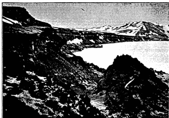
Fig. 9. Askja. Kratersøens nordlige Rand.

passerede et Krater, hvis Diameter var 500—1000 m., og endte sluttelig paa den højeste Del af Askjas Kraterrand, umiddelbart over Kratersøen. En fuldstændig lodret Klippevæg skilte os fra Søen dybt under os. Her slog vi Telt. Et mere ejen-