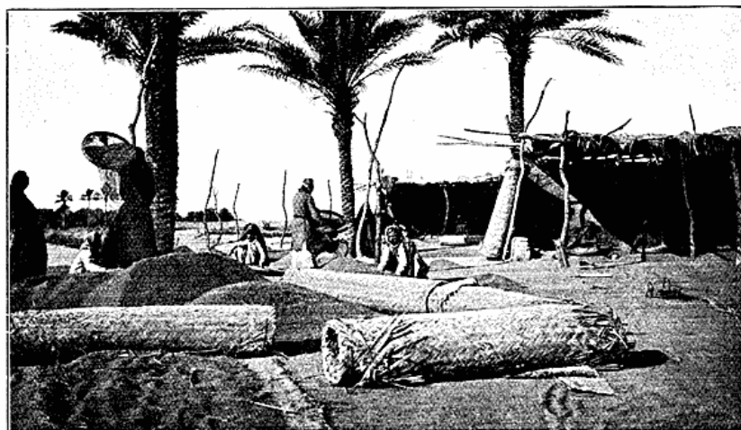
Rismølle ved Euftrat.

Af Frugter dyrkes navnlig Appelsiner, Citroner, Lemoner, Granatæbler, Æbler, Kvæder, Aprikoser, Blommer, Mandler, Figen, Morbær, Oliven og Druer. Af Grøntsager kan paa Grund af Landets stærkt varierende Klima næsten alle Arter trives, baade de, der er hjemmehørende i de tempererede Zoner, og de, der tilhører Tropicerne. Grøntsagerne dyrkes i Reglen i Palmelundene mellem Palmerækkerne.