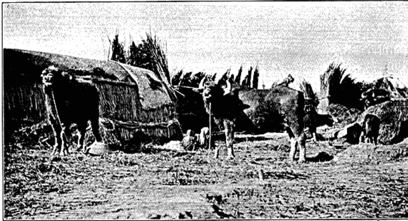
Straahytteby ved Nasrie.