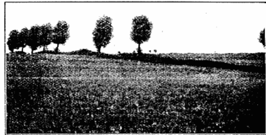
Fig. 3. »Bølgedige« med Træbeplantning.

sig den Ulejlighed at opkaste omkring Markerne. De er Udtryk dels for en massiv Opfattelse af de ny Jordfordelingsforhold dels for, at man ikke havde noget som helst Opfattelse af, at der var trangt med Plads og Jord. Den moderne Bonde har forlængst indset, at de brede Hegnsvolde optager alt for megen Plads af den kostbare Agerjord, og mange højede Hegnsvolde er allerede sløjfede, og den frugtbare Jordmasse spredt ud over Agrene. Efterhaanden vil de helt forsvinde.