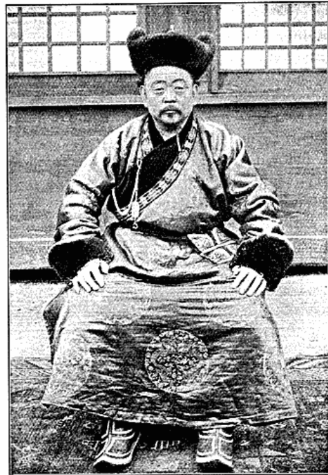
Høj mongolsk Embedsmand.

Naar man forestiller sig, at et lille Folk paa 2-3 Millioner Mennesker (dette er det omtrentlige Tal for hele Mongoliet), maaske end ikke saa mange, skal underholde et Par Hundrede regerende Fyrster med deres Hofstat og Hærskare af højere og lavere Embedsmænd, og naar man endvidere bagved Fyrsterne tænker sig den store Vampyr, den graadige kinesiske Regering, der gennem sine