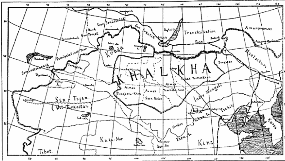
Kortskitse visende Khalkhas Omraade og Beliggenhed i Forhold til Kina og Rusland.