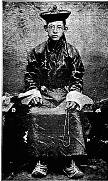
Ungdomsportræt af Gigénen, den unge nuværende mongolske Khan eller Konge. Han er nu ca. 40 Aar.

Den gængse Forestilling om Mongoliet som en uendelig, vandfattig Slette af Steppe eller Ørkenkarakter passer slet ikke paa Khalkhalandet; thi dette bærer i et Bælte, 300 Km. bredt, langs Nord-