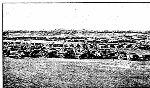
Parti af Urga. I Forgrunden en Oksekaravaue.