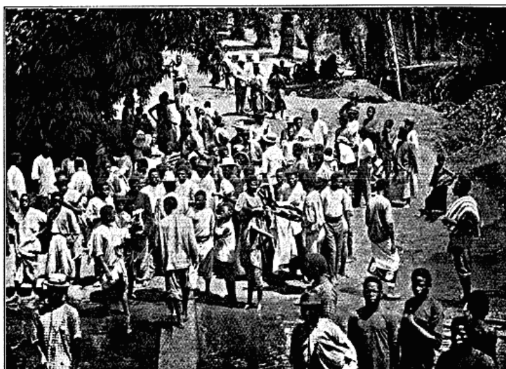
Ved en Dampers Ankomst til Mopolenge.

Med Hensyn til Raceinddeling kan Hovedparten af Beboerne henføres til de tre Kasai-Stammer: