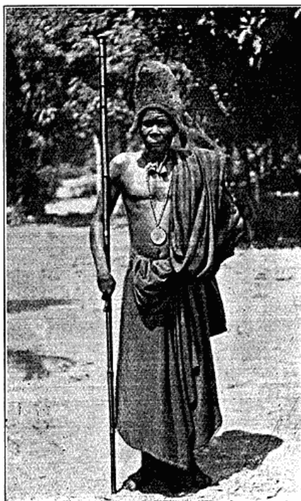
Høvding fra Bolobo.

Man kunde se, at de morede sig over Evropæernes Bornethed.