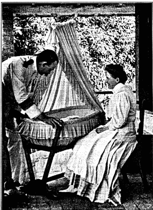
Europæisk Familieliv i Kongo.

I Batetelaerne har man en af de smukkeste og stolteste Stammer, der forøvrigt i det hele er stærkt paavirket af de arabiserede Negerfolk Øst for Lomamifloden. Det er et udpræget Krigerfolk, der ikke altid afventer, men ogsaa søger Anledning til Strid med Nabostammerne, som det er i høj Grad overlegen. Hvad der har gjort den yderligere frygtet, navnlig i den sydlige Del af Distriktet, er