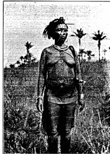
Tatoveret Balubana mifundi Kvinde

Balubaerne adskiller sig i en Mængde Understammer, tildels med forskellige Dialekter. Men Hovedforskellen dannes af Tatoveringen, der enten kan være i kongruente Mønstre som hos Balubana mifundi, eller blot uregelmæssige, ligesom planløst smaalhuggede Masker som hos Balubana tapo.