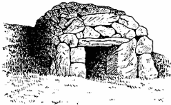
Et casa honda fra Fuerteventura.

i det mindste for to af Øernes vedkommende, Lanzarote og Hierro; hvorvidt de fandtes andetsteds er tvivlsomt, men man maa i saadanne Tilfælde huske, at det at de ikke omtales, aldeles ikke behøver at betyde, at de heller ikke fandtes.