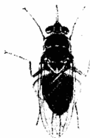
Glossina palpalis. Forstørret 3\frac{1}{4} Gange.

Blandt Tropernes særlige Sygdomme har ingen i Nutiden tiltrukket sig Opmærksomheden mere end den afrikanske Sovesyge. I Slutningen af forrige Aarhundrede fik man vel Øjet op for den, men den blev kun lidet paaagtet, man ansaa den nærmest kun for en Kuriositet og ret sjælden Neger-sygdom. Siden ca. 1900 har man imidlertid set sig nødsaget til at tage mere Hensyn til den paa Grund af dens pestagtige Optræden, og der er da ogsaa fra tysk, engelsk, fransk og belgisk Side bleven udsendt adskillige Ekspeditioner til de angrebne Egne for at studere Sygdommens Karakter og finde Midler til dens Bekæmpelse. Den Vildfarelse, at Sygdommen var en absolut Neger-sygdom, har haft de sørgeligste Følger; den angriber nemlig alle Menneskeracer uden Forskel.