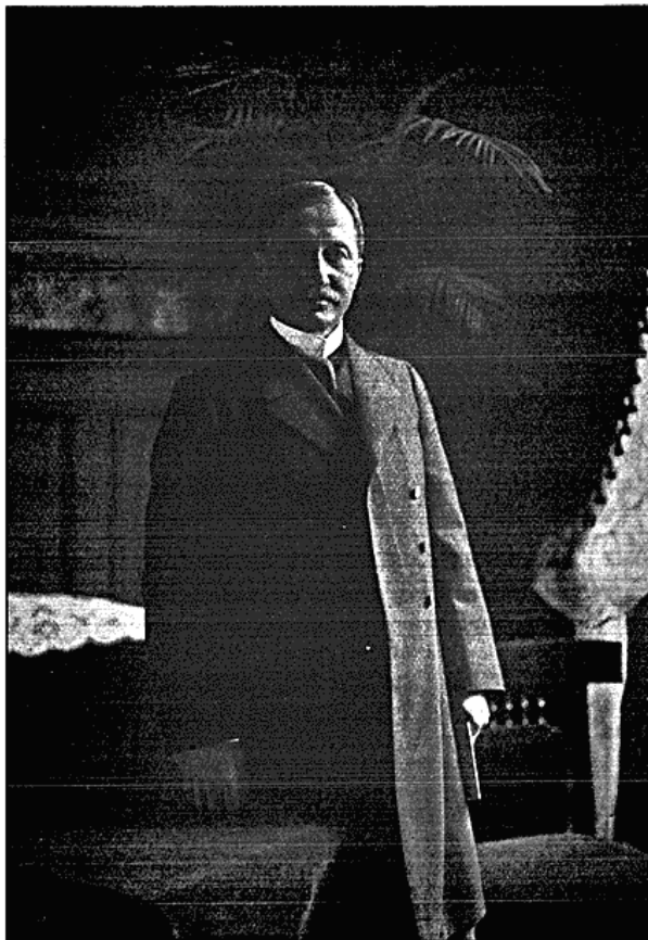
DR. FREDERICK A. COOK.

Under stormende Bifald fra den store Forsamling besteg Dr. Cook Talerstolen, takkede for den udviste Ære og gik derefter over til sit Foredrag, der holdtes paa engelsk. Foredraget støttedes af et stort af Selskabet udarbejdet Kort, og desuden var der til alle Selskabets Medlemmer uddelt et Expl. af dette Kort i Miniatur. Da Dr.