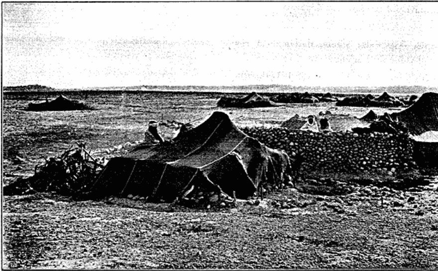
Faste Teltbeboere udenfor en Oase i Syd-Algier.

Videre gaar det op i Kabylernes Bjærg, langs de maleriske „gorges de Palestro“ og forbi Nybyggerlandsbyen Palestro, hvis Indbyggere 1871 nedsabledes af Kabylerne. Mod Nord ses Djurdjura-Kæden, der i Foraartiden endnu dækkes af mægtige skinnende hvide Snemasser, og foran Bjærgene ligger Kabylerslandsbyerne og kroner Højenes Toppe. Bebyggelsen er dog her temmelig svag og kan ikke i Tæthed og Ejendommelighed maale sig med den paa Djurdjura's Nordside. Ved Bouïra traf jeg en, Teltlejr af den almindelige arabiske