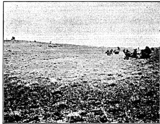
Af Nomader tilsaaet Terræn paa Højsletten Nord for Djebel Aurès. Marken er fuld af Græstuer og andre vildtvoksende Planter, der ikke er bleven ryddet bort. I Baggrunden til Højre staar Enebærbuske midt i Saaningen. Kornet, der endnu knap er kvarterhøjt, modnes i Juni. (Fot. først i Maj 1908.)