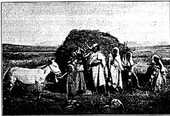
Indfødte foran deres Straa-Gourbi i Nord-Tunis.

I Medjerda Bjærgene i Nærheden af Duvivier saa jeg en Mand og en Kvinde i Færd med at bygge en gourbi. Stellet var omtrent rejst færdigt. Med en indbyrdes Afstand af 5—6 Skridt var rejst to foroven kløfede Stænger eller temmelig tynde Træstammer, der foroven bar en vandret Mønningstok. Væggene bestod af armtykke nedrammede Pæle, der ligesom Stammerne var ganske ubearbejdede, og endelig dannedes Tagets Skelet af Stokke, der som Sparrer var ophængte til begge Sider fra Mønningstokken nedtil Langsvæggene. Taget dannes ved en Belægning med Grene og Straa;