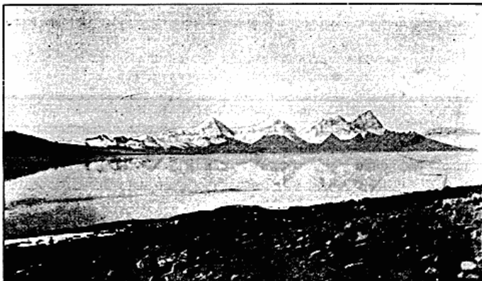
Søen Bamtso og Butankæden.

Den 14. Juli gik Ekspeditionen fra Gjangtse mod Øst og Nordøst ad Lhasa til, og var mærkelig nok her i Juli Maaned stærkt hindret i sin Marche af heftig Regn. Forf. føjer til, at September er meget regnfuld i Tibet, og at navnlig Bramaputradalen faar betydelig Regn, hvad der jo afkræfter tidligere Udtalelser om, at Tibet var et regnløst Land. Over det 4877 Karo-la Pas kom Eksp. til den morsomt formede Sø Yamdok Tso, der som en Ring omgav en bjærgfuld Ø, og dens Farve vekslede fra violet til turkisblaa og grøn. I tre Dage marcheredes langs den smukke Sø, og nu var der kun et Pas tilbage, før man kunde se ned i Bramaputradalen og næsten ned i Lhasa selv. Efter at have overskredet dette Pas, Khamba-la (Højden angives ikke), befandt man sig ved Floden Bramaputra, der her deler sig i et Utal af Arme, som passeredes ved at spænde Tove over dem, hvortil Færger knyttedes; under Overgangen druknede en Officer i Floden. Floddalen er 5—8 Km. bred og vel dyrket; Hvede og Bygmarker ses overalt, der er mange Lands-