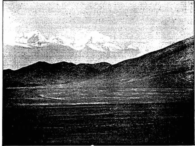
Mount Everest, set fra Khambajong.

voksende til henad Em., og nu kom mægtige Skymasser svævende ind fra Indien, Sue faldt undertiden; tilsidst indhylledes alt i Sne, og Skildvagterne havde om Natten Møje med at holde sig oprejste i den hylende Storm og det stærke Snefald. Kulden tiltog betydeligt, og hele Januar, Februar og Marts vedblev den bidende Vind, ledsaget nu og da af Sne. Efterhaanden som Ugerne gik, steg allertemperaturen, og i April afmarcheredes der til Byen Gjangtse. Dalen her omkring er c. 8—10 Km. bred, overalt opfyldt af blomstrende Landsbyer og gennemskaaet af Vandingskanaler. Rundtom ved alle Landsbyer og Kanaler voksende Pile og Popler. Den gennemtrængende Kulde i Tuna var nu forbi, det frøs en Smule om Natten, men Dagene var begunstige af smukt Solskinsvejr. Freden blev her brudt af Tibetanerne, der angreb Ekspeditionen, men blev slaede.