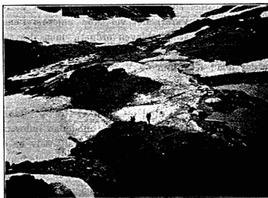
Fra Bopladsen Kangek i Godthaabsfjordens Munding. I Mellem- og Baggrunden ses Gammeldagsvinterhuse, hvis Tag er aftagne ved Foraarets Begyndelse, for at Solen i Sommerens Løb kan desinficere det Indre. I Forgrunden t. h. ses Taget af et nymodens Hus.

Alaska. Indførelsen vil mulig ogsaa kunne anvendes. I Julianehaabs Distriktet findes i det mindste to Steder: Igaliko og Narsak , hvor der med stor Fordel holdes Køer, paa det førstnævnte Sted endog c. 30. Forfatteren spiste i 1894 Smør herfra, der var særdeles godt. Foreløbig vil Grønlandernes Naturel vel være til Hinder for Kvægavl i større Stil. Ved først at vænne dem til Rensdyrhold kunde man maaske bedre lede dem ind paa Kvæghold i større Omfang. I Nordbo-tiden levede omtrent 3.000 Mennesker i Øster- og Vestbygden paa c. 300 Gaarde hovedsagelig af Kvægavl, men ogsaa af Jagt, Fiskeri og Sælfgangst.