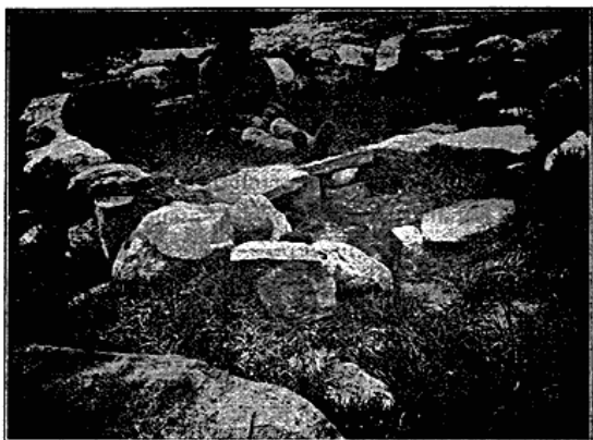
Gammel Sommerteltplads i Agdlumersat Fjorden. Stenkresen har skærmet Teltets bagerste Del. Kvinden sidder paa Briksen, hvis Forside er afgrænset af Sten.

landske Øvrighed kan benytte. Der er dog ingen tilbagegang , men dens Personale i Grønland har ofte for lidt Kendskab til den grønlandske, nationale Tankegang, thi de kan for det meste ikke Sproget godt nok dertil.