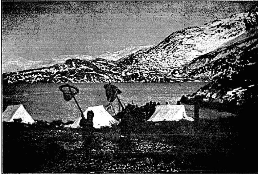
En Fiskeplads i Godthaabsfjorden.

Folkene ligger i Lærredstelte. I Forgrunden er Jorden bedækket med Angmagssætter, der ligger til Terring. Denne Fisk fanges eller „oses“ op i Næt, af den Slags, Pigerne holder i Vejret. Det danske Flag der ses, vajer paa Inspektorens Baad.