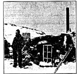
Ignatius, foran sin Bolig ved Godthaab.

„Jeg lod øjeblikkelig dreje bi, men vi blev ligesaa hurtigt kastede ned mod et Isfjæld, og samtidigt paasejlet af den opbrækkede Nyis , som Stormen førte med sig, og Konebaaden blev