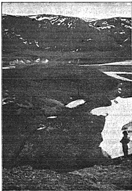
Ved Nansens Teltplads Nr. 41.

Nansen og Sverdrup havde saaledes bygget deres Baad kun nogle faa Skridt fra den gamle Sæter, ligesom de ogsaa inde i selve „Austmannadalen“ paa et Sted, der ligger noget Øst for deres derværende Telt-