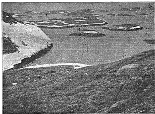
Parti ved Egedes første Bolig. (Ruinerne ligge i Lavningen t. V.).

Endnu 1730 omtales der paa Stedet „et efterstaaende Proviand Hus paa den gamle Kolonis Ø“, sandsynligvis det samme. I 1724 den 4. Juli druknede en Dreng i „en Dam eller lidet fersk Vand, straks overfor Kolonien“, hvilket Egede tog sig meget nær. Som vi have hørt, findes der netop overfor Boligen en saadan lille Dam. I denne er iøvrigt for ca. 40 Aar siden fundet Klingen til en Sabel. Egede boede ialt paa „Haabets Ø“ i fem Aar, indtil han og hans Familie efter Governør Paars Ankomst til Landet (1728) flyttede til Godthaab, hvorfra Paars, som bekendt, i April det