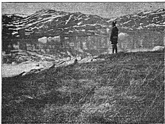
Paa Nordbogaardens Hjemmemark. (Kvannitfjorden).

Paa Hjemvejen besøgte Ruinerne ved Arsuk , i Kungnaitbugten og Ivinguitbugten . Den 27. dampede vi ind i Ikuffjorden , hvor der har ligget to Nordbogaarde. Endnu samme Aften løb vi ind i „ Taylor's Haven “ ved Arsukfjordens Munding paa søndre Side, i hvis Nærhed, der