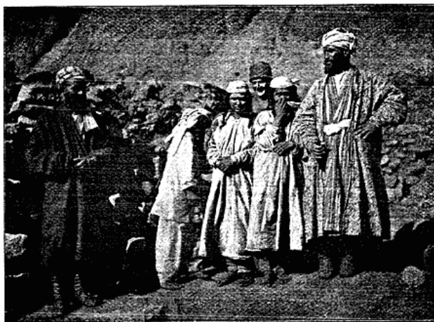
Kvinder fra Garan.

til at høste Korn og Græs med; Buer af Træ med Tarmsnore, som de ved at lade Strangen slaa ind paa Ulden rense denne med, og nogle Sigter til at rense Korn i, lavede af Snore, ere i Reglen det Hele. Enkelte Garanere kjærne Smør, der ikke smager som dansk, men har en egen ubestemmelig fedtet Smag. Til Produktion af Smørret anvendes en meget primitiv Kjærne, der sammenstilles paa følgende Maade: En stor Ler-