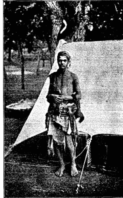
Fattig Indfodt fra Garan.

meget, som de Indfødte ere i Stand til at yde, thi dette svarer til deres Forestillinger om en stor Mand, og ved Afrejsen bør man da heller ikke glemme at yde dem tilstrækkelig Gjengjæld i Gaver eller Penge for den Høflighed, man maaske indirekte har tiltunget