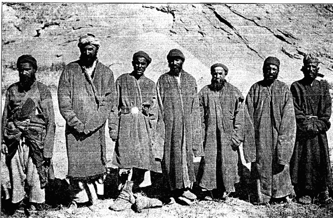
Indfødte fra Garan.

Fra Delaack gaar Stien i et Utal af Slynninger med bratte, vanskelige Fald ned langs Floden Sijaav (Biflod til Garm tjaschma Darja) og dens Bifloder, der vande Bjærgskraaning og afgive Vand til de smaa