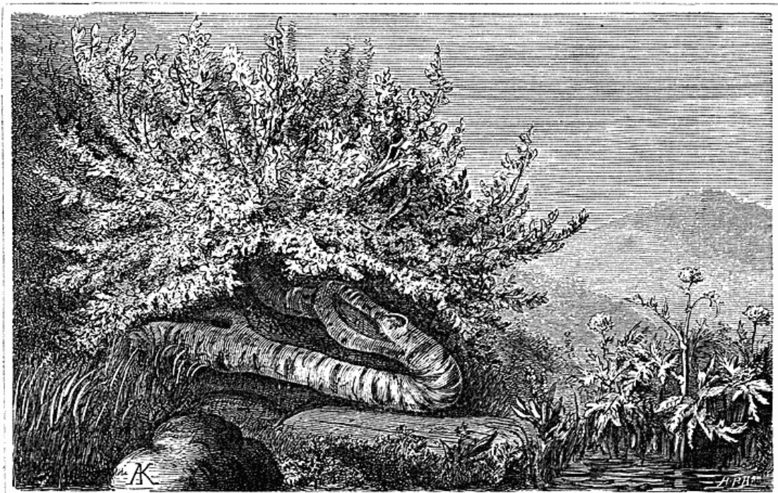
Tegnet af A. Kornerup.